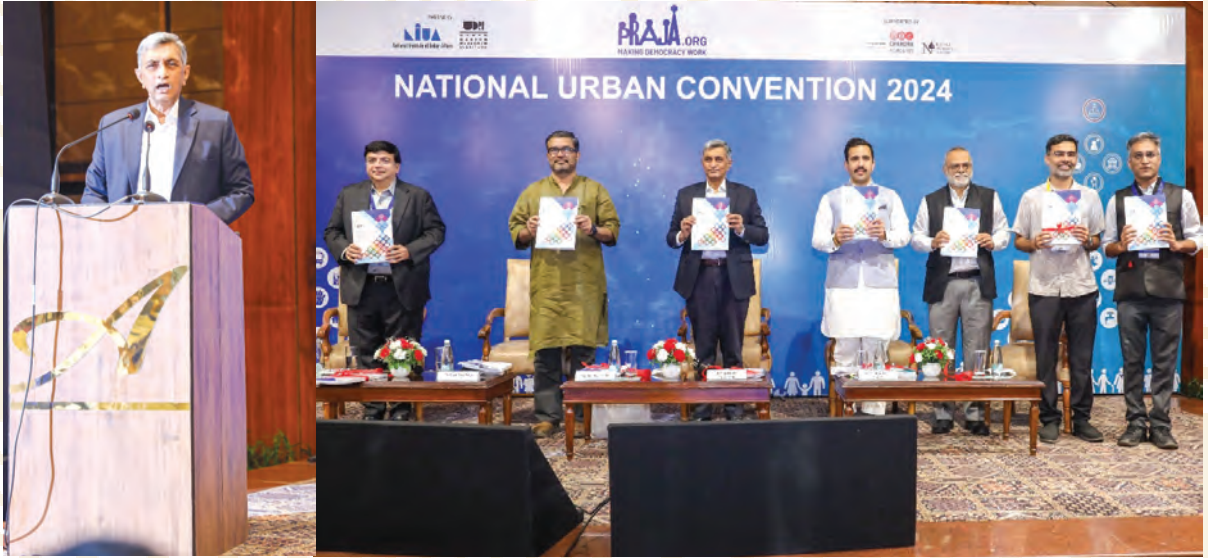
ప్రజా ఫౌండేషన్ ఆధ్వర్యంలో న్యూఢిల్లీలో జరిగిన జాతీయ పట్టణ సదస్సులో ప్రజాస్వామ్య పీఠం (ఎఫ్డీఆర్), లోక్సత్తా వ్యవస్థాపకులు డాక్టర్ జయప్రకాష్ నారాయణ్