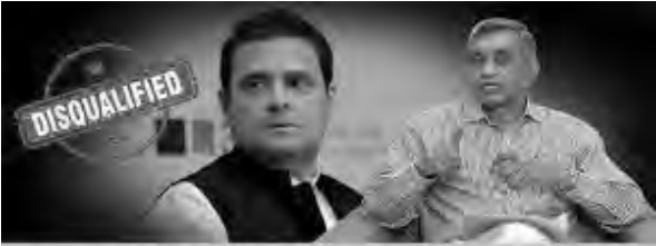
రాహుల్ సీటులో ఉప ఎన్నిక ప్రకటించాద్దు.. అనర్హతవేటు తొందరపాటు

“ప్రజాప్రతినిధికి శిక్ష పడితే అప్పీల్ తేలేదాకా అనర్హత వేటు వేయకూడదని 1951లో తాత్కాలిక పార్లమెంటు/ రాజ్యాంగ సభ ప్రజాప్రాతినిధ్య చట్టంలో నిర్దేశించింది. ఆ పదవీకాలం వరకే ఆ మినహాయింపు వర్తింప చేయాలన్నది వారి ఉద్దేశం. అయితే ఆ మినహాయింపుకి ఎన్నికల సంఘం విపరీతాధానిచ్చి అప్పీల్ తేలేవరకూ ఎన్ని ఎన్నికలకైనా వర్తింపచేయచ్చని వెసులుబాటు ఇచ్చింది. 61 ఏళ్ల పాటు ఆ తప్పును కొనసాగించింది. చివరికి 2013లో ఈ వెసులుబాటును సుప్రీంకోర్టు కొట్టివేయటం సమంజసమే. అయితే ఎంతో సమతూకంతో, సంయమనంతో వ్యవహరించాల్సిన న్యాయస్థానం రాజకీయం పట్ల సమాజంలో ఉండే కోపాన్ని ప్రతిఫలించ చేస్తూ వెంటనే అనర్హత వేటు వర్తింప చేయాలని పేర్కొంటూ, ప్రజాప్రాతినిధ్య చట్టంలోని సెక్షన్ 8(4)ని కూడా కొట్టివేసింది. ఈ సెక్షన్ ని రాజ్యాంగ నిర్మాతలు ఎందుకు ప్రవేశపెట్టారోనన్న ఆలోచన చేయలేదు. అనర్హతపై ఎన్నికల సంఘాన్ని