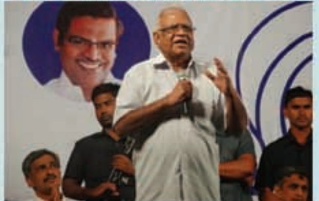
తిరుపతి 'బహిరంగసభ'లో మాట్లాడుతున్న డివివియన్. పర్వ