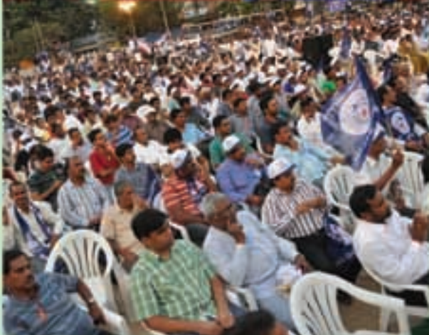
కూకట్‌పల్లిలో 'ఈల భేరి' కార్యక్రమం