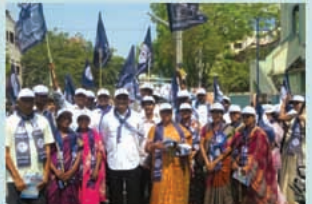
గుంటూరులో 'ఇంటింటికీ ప్రచారం' కార్యక్రమం