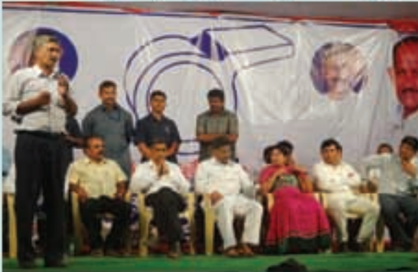
తిరుపతి 'బహిరంగసభ'లో మాట్లాడుతున్న కటాలి