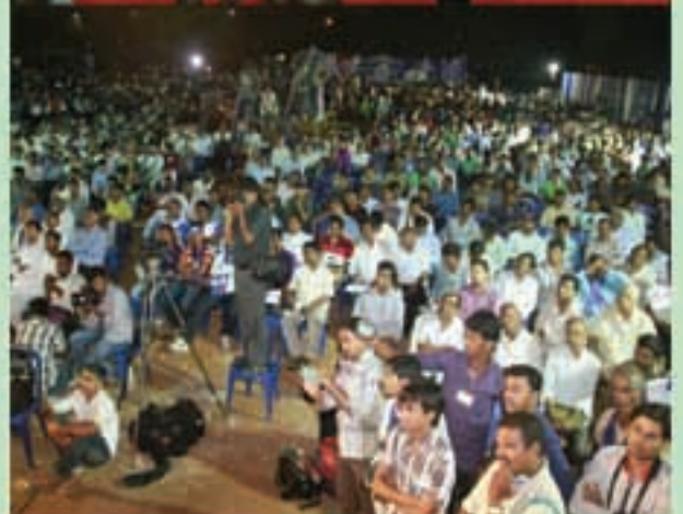
విశాఖపట్నంలో 'లోక్ సత్తా ఎన్నికల శంఖారావం' కార్యక్రమం