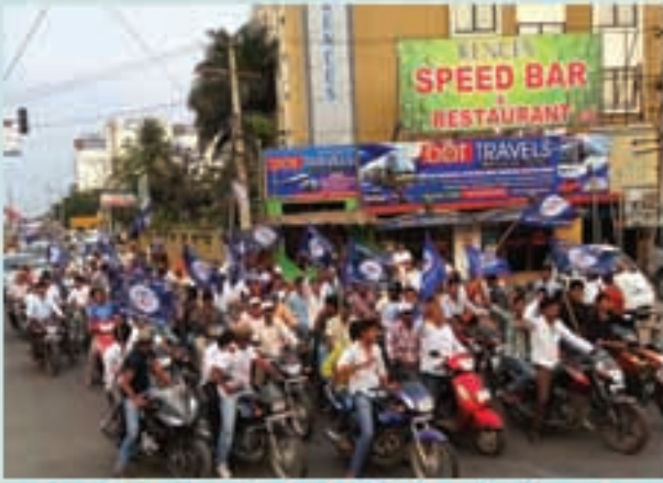
తిరుపతిలో ర్యాలీ విరూపాస్తున్న లోక్ సత్తా యువ కార్యకర్తలు