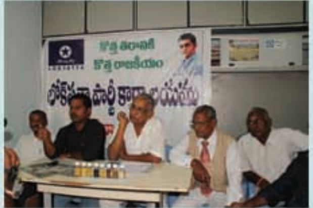
శ్రీకాకుళంలో నీటి పరీక్షలు