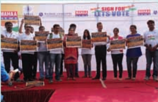
నెక్సెన్రోడ్లో యువ వలంబీర్ల ఓటర్స్ డే