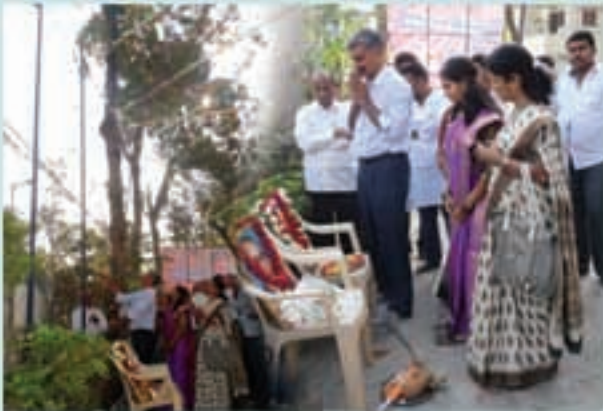
లోక్సత్తా పార్టీ కార్యాలయంలో గణతంత్ర దినోత్సవం