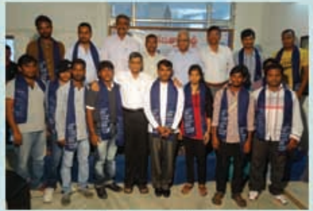
వైజిట్ అధ్యక్షులలో లోక్సత్తాలో చేరిన పరంగల్ యువత