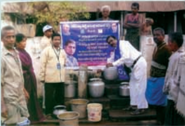
పలాస-కాశీబుగ్గ మున్సిపాలిటీలో నీటి పరీక్షలు