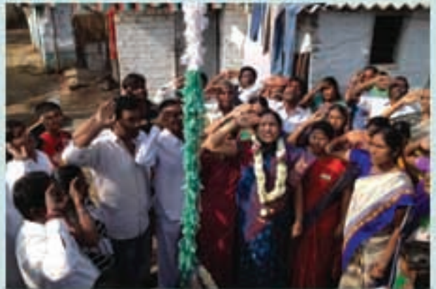
శ్యామలకుంకు బస్టిలో గణతంత్ర దినోత్సవం