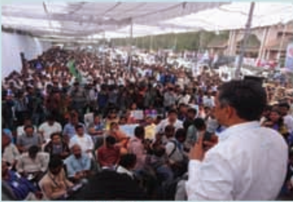
ధర్మాచాక్లో లోక్సత్తా బహిరంగ సభ