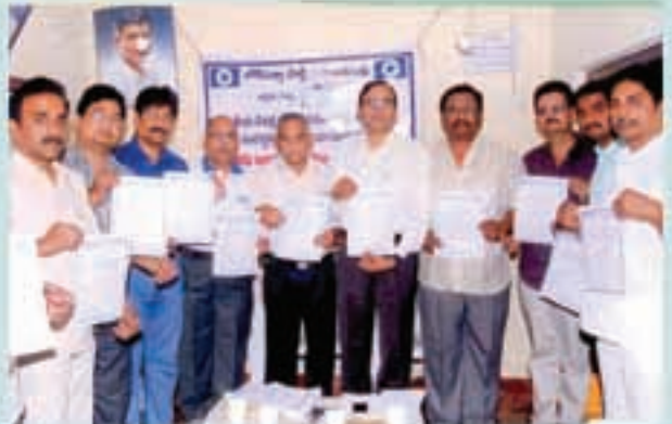
తిరుపతిలో ఓటర్ల జాగృతి కార్యక్రమం