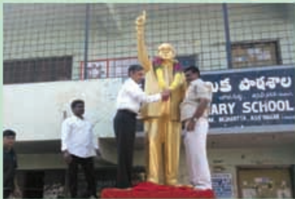
ఆసిఫాబాద్ లో అంబేద్కర్ పర్వతి