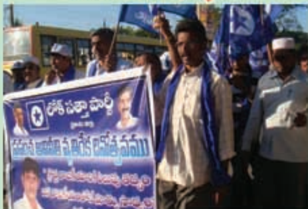
ఓంగోలులో ప్రపంచ అవినీతి వ్యతిరేక దినం