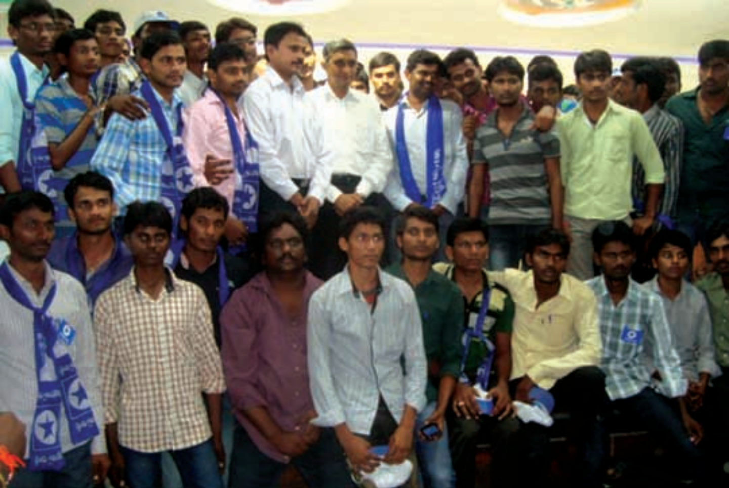
గుంటూరులో లోక్ సత్తా పార్టీలో చేరిన యువతతో డా॥ జయప్రకాష్ నారాయణ్