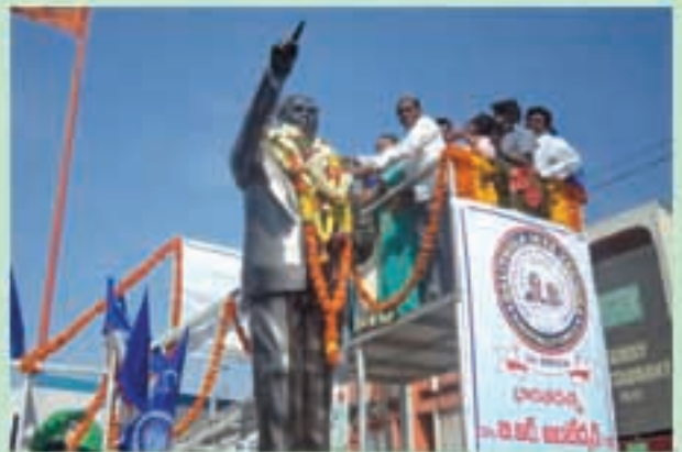
కూకట్ పల్లిలో అంబేద్కర్ పర్వతి