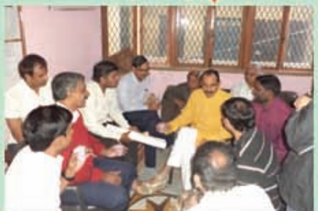
ధిల్లీ ఎన్నికల సందర్భంగా ఆమ్ ఆర్జీ పార్టీలో లోక్ సత్తా నాయకులు