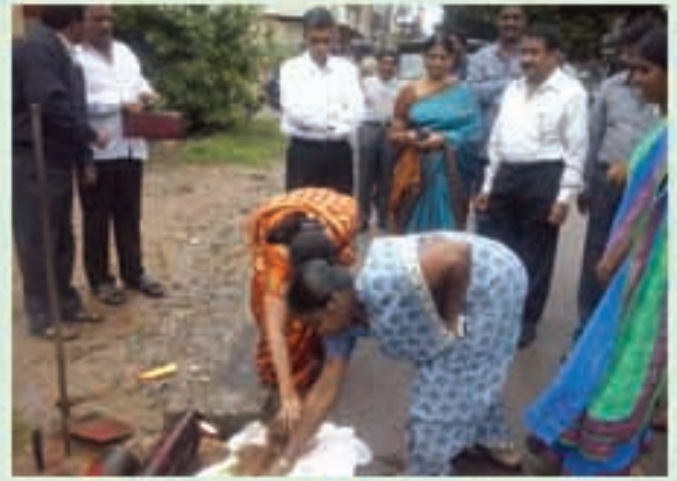
మాకట్పల్లిలో పలు నీటి అభివృద్ధి పనుల ప్రారంభోత్సవంలో డా॥ కేసీ