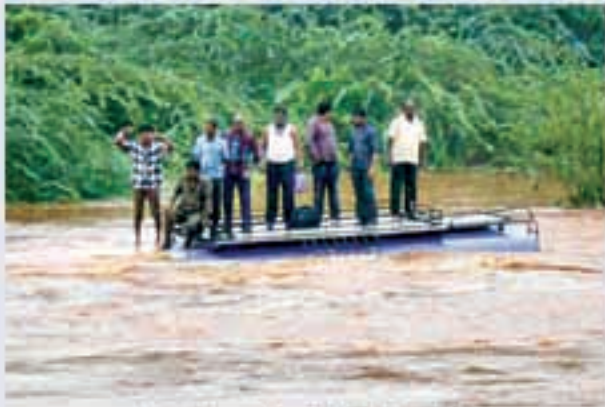
ప్రకాశం జిల్లా ఎదురాల్లపాడు ముని బాగులో చక్కూర్న బస్సు సైకిళ్ళ సవరణకు కోసం ఎదురుచూస్తున్న ప్రయాణీకులు