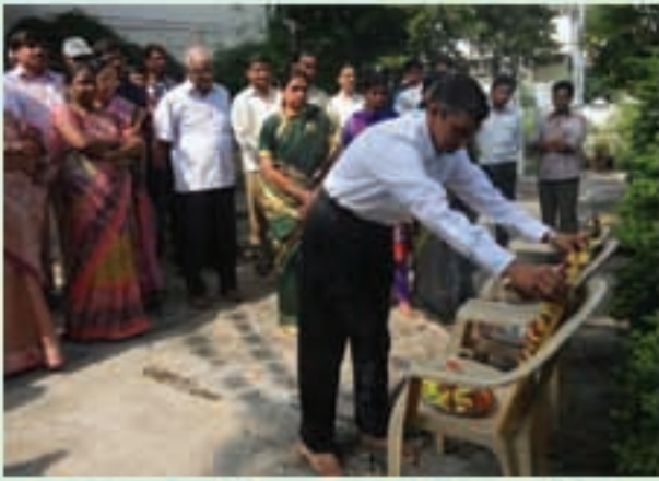
రాష్ట్ర కార్యాలయంలో నవంబరు 1 రాష్ట్ర ఆవరణ దినోత్సవం