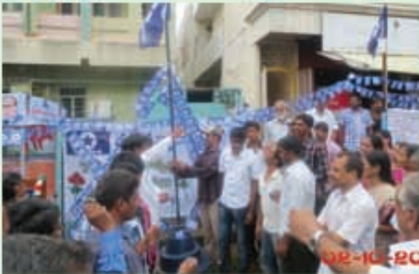
గుంటూరులో లోక్ సత్తా పార్టీ 7వ వార్షికోత్సవం