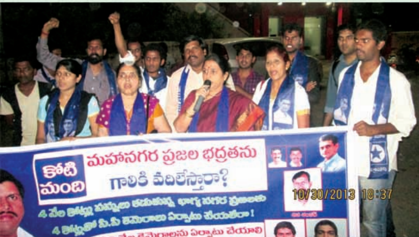
జూబ్లీహిల్స్ లో సీసీ కెమెరాల ఏర్పాటు కోసం ఉద్యమం