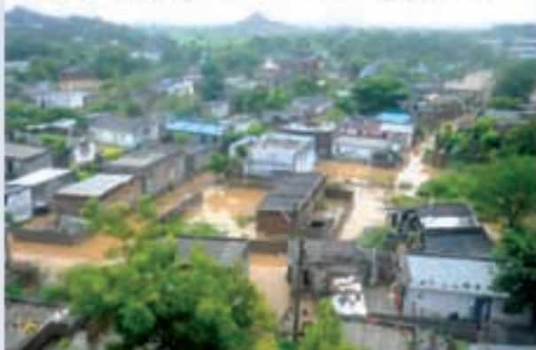
ఓనరుచూళిగల్లో వరద నీటిలో చక్కూర్న బస్సు