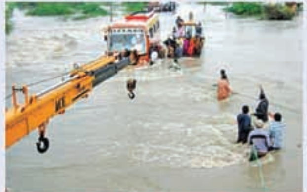
గుంటూరు జిల్లా నరసరావుపేటలో వరదలో చక్కూర్న బస్సులోని ప్రయాణీకులను రక్షిస్తున్న లడదారులు, ప్రజలు