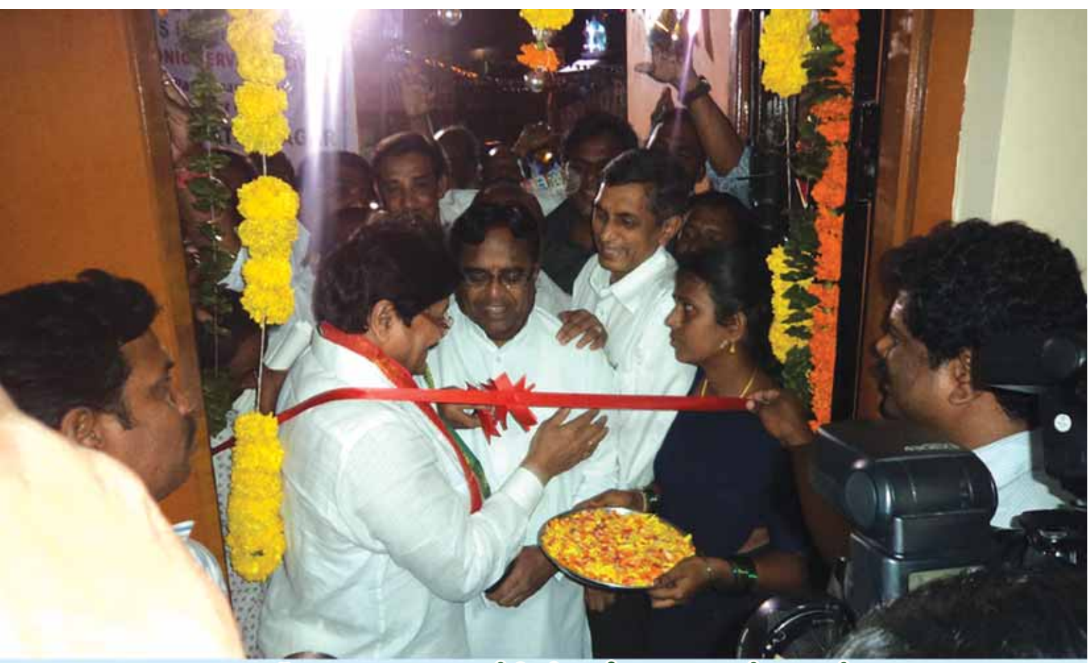
కూకట్‌పల్లి నియోజకవర్గంలో మీ సేవా కేంద్రం ప్రారంభోత్సవంలో కేంద్రమంత్రి సర్వే సత్యనారాయణ, రాష్ట్ర మంత్రి పొన్నాల లక్ష్మయ్య, ఎమ్మెల్యే డా॥ జేపీ