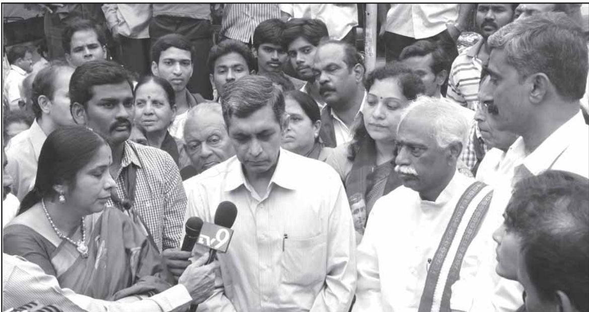
ఆగస్టు 16న లోకసత్తా పార్టీ జాతీయ అధ్యక్షుడు డా॥ జయప్రకాష్ నారాయణ్, బీజేపీ నేత దత్తాత్రేయ పార్కు స్థలాన్ని సందర్శించి పార్కు కబ్జా సమస్యకు శాశ్వత పరిష్కారం దిశగా చర్యలు తీసుకుంటామని ప్రకటించారు.

ఘటన వివరాలిలా ఉన్నాయి... తమ కాలనీలో పర్యావరణ పరిరక్షణ కోసం, తాము కాస్త సేదతీరటం కోసం పార్కును అభివృద్ధి చేసేందుకు వెంకటరమణ కాలనీవాసులు సుమారు 50 ఏళ్ల క్రితం 625 గజాల స్థలాన్ని తమ సొంత డబ్బుతో హైదరాబాద్ మునిసిపల్ కార్పొరేషన్ కి బహుమతిగా ఇచ్చారు. ఎంసీహెచ్ వత్రాలు కూడా ఇదే విషయాన్ని స్పష్టంగా పేర్కొంటున్నాయి. అయితే పార్కు స్థలాన్ని కాపాడటంలో, అభివృద్ధి చేయటంలో ఎంసీహెచ్ నిర్లక్ష్యాన్ని, ఉదాసీనతను ఆసరాగా చేసుకుని గత పాతికేళ్లుగా కొందరు రాజకీయ అండతో