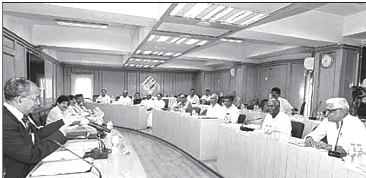
ఢిల్లీలో అన్ని పార్టీల సమావేశంలో మాట్లాడుతున్న కేంద్ర ప్రధాన ఎన్నికల కమిషనర్ వి.ఎస్. సంపత్

“దేశం పట్ల తన భవిష్యత్ దృక్పథాన్ని ఎన్నికల ప్రణాళికలో పేర్కొనే హక్కు ప్రజాస్వామ్య వ్యవస్థలో ప్రతి పార్టీకి ఉంటుంది. దేశాన్ని పాలించేందుకు ఏ రాజకీయ పార్టీని ఎన్నుకోవాలన్నది ప్రజల ఇష్టం. ఉచిత ల్యాప్ టాప్ లు, సైకిళ్లు, పేదలకు మందులు