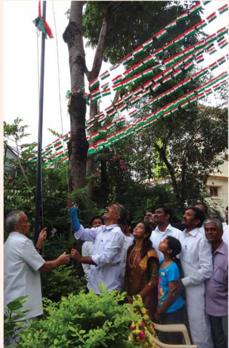
లోక్‌సత్తా పార్టీ రాష్ట్ర కార్యాలయంలో జాతీయ జెండా ఆవిష్కరణ