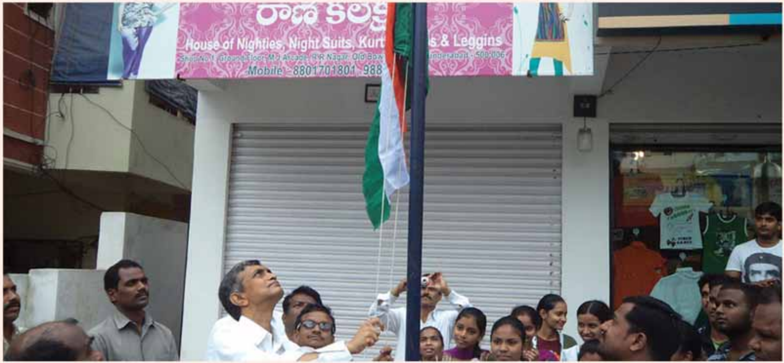
కూకట్‌పల్లిలో స్వాతంత్ర్య దినోత్సవం సందర్భంగా జెండా ఆవిష్కరిస్తున్న డా॥ జేపీ