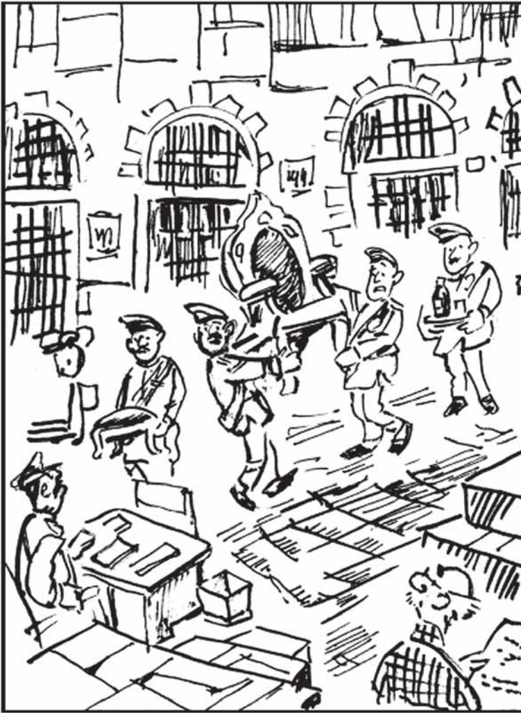
శిక్ష పడిన విఐపికి కేటాయించిన సెల్ ఎక్కడ ఈ సామాను అక్కడ పెట్టమని చెప్పారు సార్.....