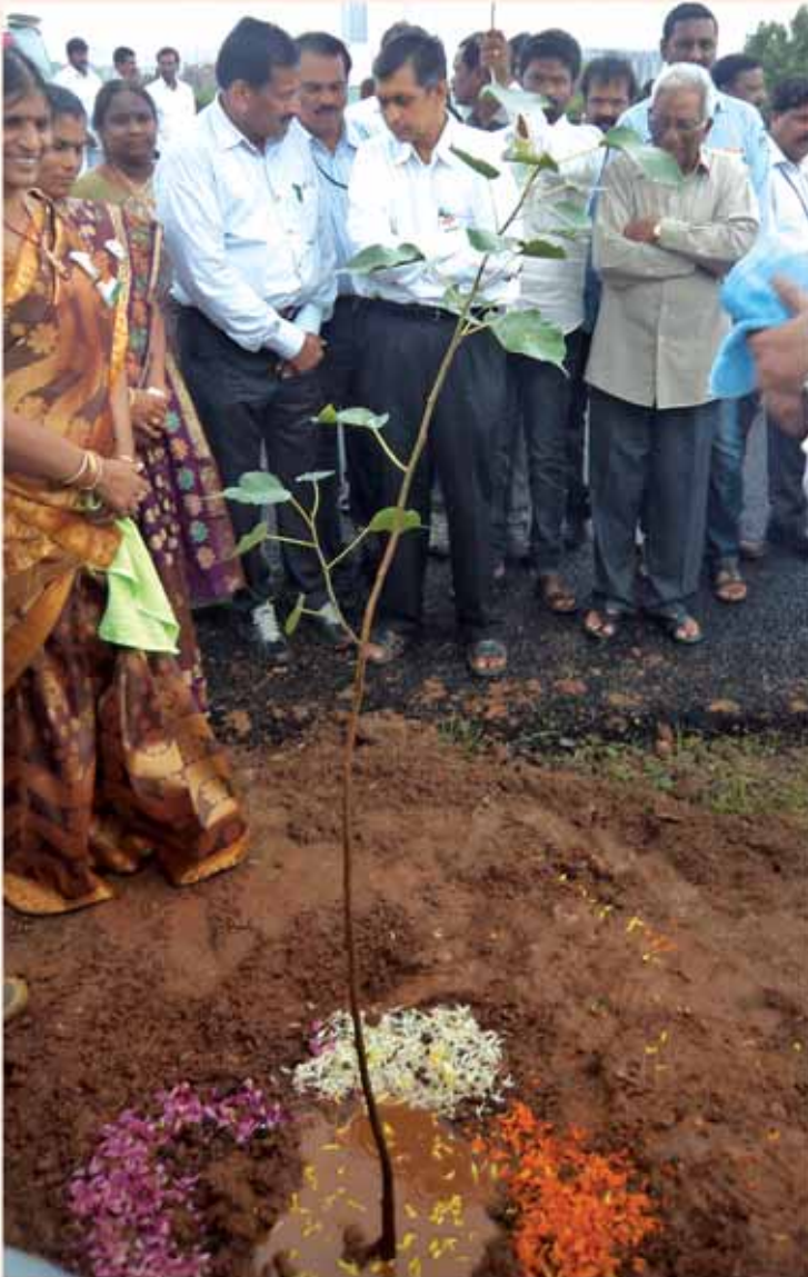
కూకట్‌పల్లిలో మొక్కలు నాటే కార్యక్రమంలో డా॥ జేపీ