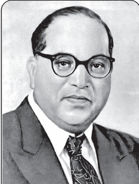
ఏప్రిల్ 14 అంబేద్కర్ జయంతి

ప్ర జాస్వామ్యం అనేది సంక్షోభంలో చిక్కుకోకుండా విజయవంతంగా పనిచేయాలంటే కొన్ని ప్రమాణాలను పాటించాలి. ఈ అంశం గురించి చర్చించే ముందు కొన్ని ప్రాథమిక సూత్రాలను గమనంలోకి తీసుకోవటం అవసరం. మొదటిది: ప్రజాస్వామ్యం ఎప్పుడూ ఒకే తీరులో ఉండదు. ప్రజాస్వామ్య భావన ఎప్పటికప్పుడు స్థాయిలో మార్పు చెందుతూ వస్తుంటుంది. ఉదాహరణకు గ్రీకుల అథీనియన్ ప్రజాస్వామ్యం వేరు. ఇప్పటి మన ప్రజాస్వామ్యం వేరు. నాటి గ్రీకు సమాజంలో సగం మందే పౌరులు. మిగిలిన సగం బానిసలే. బానిసలకు ఎటువంటి రాజకీయ హక్కులు ఉండవు. మన ప్రజాస్వామ్యం ఇందుకు పూర్తిగా భిన్నమైనది. రెండవ అంశం: ప్రజాస్వామ్యం ఒకే దేశంలో కూడా ఒకే రకంగా ఉండదు. ఇంగ్లండ్ చరిత్రనే తీసుకుంటే, 1688 విప్లవం ముందు ప్రజాస్వామ్యం వేరు, తదనంతరం వేరు. మళ్ళీ 1832 చట్టం తర్వాత ప్రజాస్వామ్యం లక్షణంలోనే కాదు లక్ష్యంలో కూడా మార్పు వస్తుందని మనం గమనించాల్సిన మూడవ విషయం. పురాతన ఇంగ్లిష్ ప్రజాస్వామ్యాన్ని గమనిస్తే లక్షణం, లక్ష్యాలలో మార్పు కనిపిస్తుంది. రాజు నిరంకుశ అధికారాన్ని అడ్డుకోవడానికి ప్రజాస్వామ్య చర్యలు అవసరమయ్యాయి.