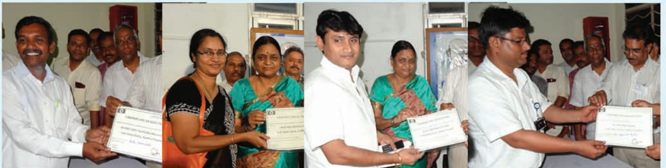
ఈద చెన్నయ్య కార్యదర్శి (ఎస్.సి, ఎస్.టి, బి.సి, మైనారిటీ)