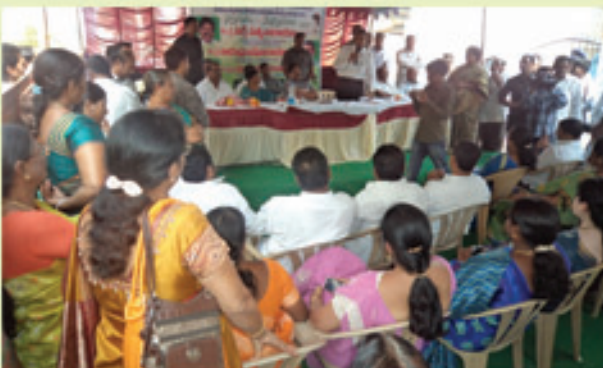
మహిళామండలి మరియు వయోవృద్ధుల భవన నిర్మాణ శంఖుస్థాపన కార్యక్రమంలో డా॥ జేపీ, సర్వే