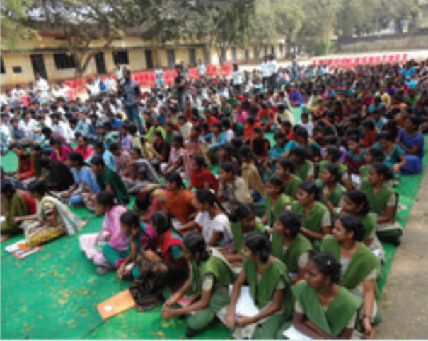
ఖమ్మం ప్రభుత్వ పాఠశాల విద్యార్థులతో డా॥ జేపీ