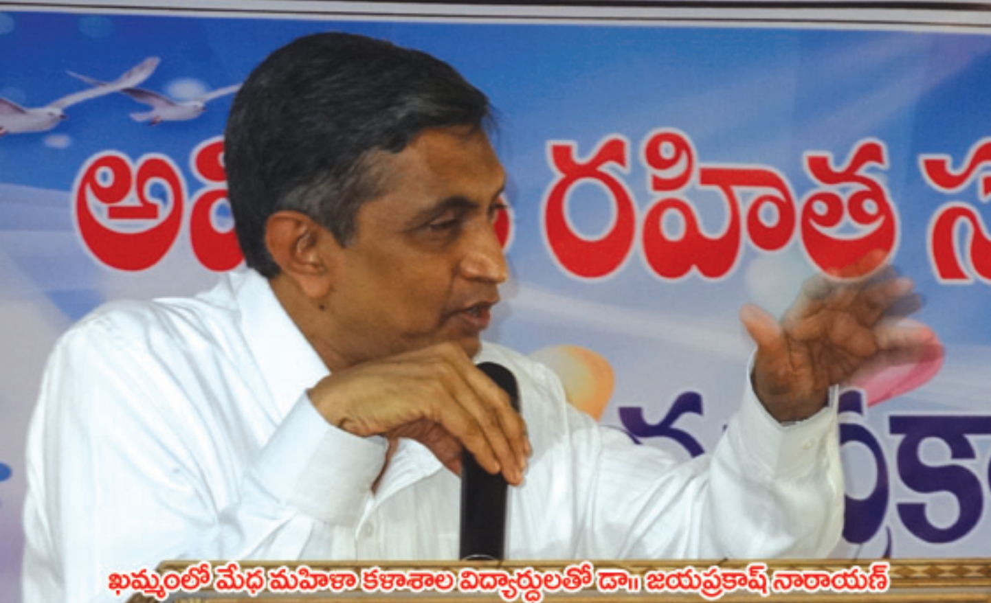
ఖమ్మంలో మేధ మహిళా కళాశాల విద్యార్థులతో డా॥ జయప్రకాష్ నారాయణ్