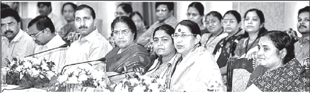
జూబ్లీహిల్స్లో జరిగిన సదస్సులో మాట్లాడుతున్న కేంద్ర స్త్రీ, శిశు, సంక్షేమశాఖా మంత్రి కృష్ణ తీరథ్, చిత్రంలో రాష్ట్ర మంత్రి సునీతాలక్ష్మారెడ్డి, ఉన్నతాధికారులు ఉన్నారు