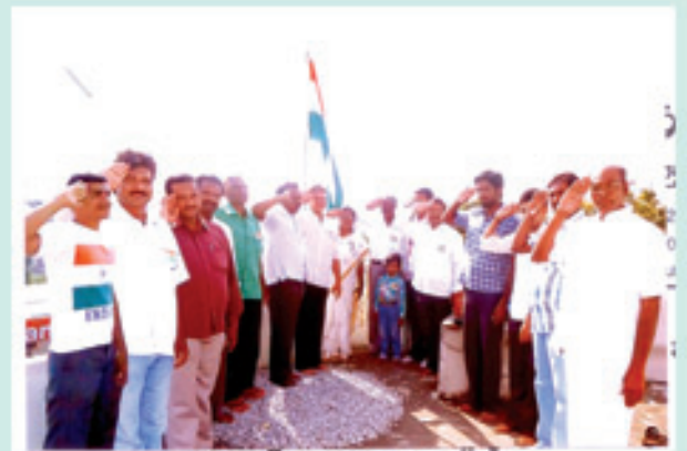
చిత్తూరులో గణతంత్ర దినోత్సవ సందర్భంగా...