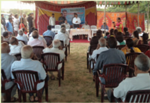
కూకట్ పల్లి అభివృద్ధి కార్యక్రమాల సభలో జేపీ