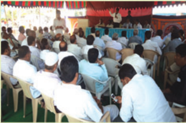
కూకట్ పల్లి అభివృద్ధి కార్యక్రమాల సభలో జేపీ