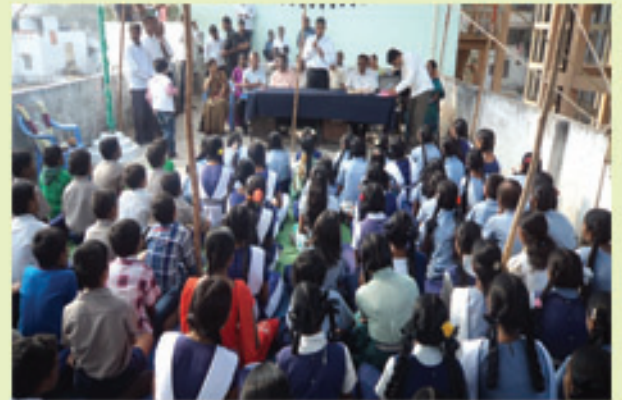
బాలనగర్ హైస్కూల్ విద్యార్థులతో జేపీ