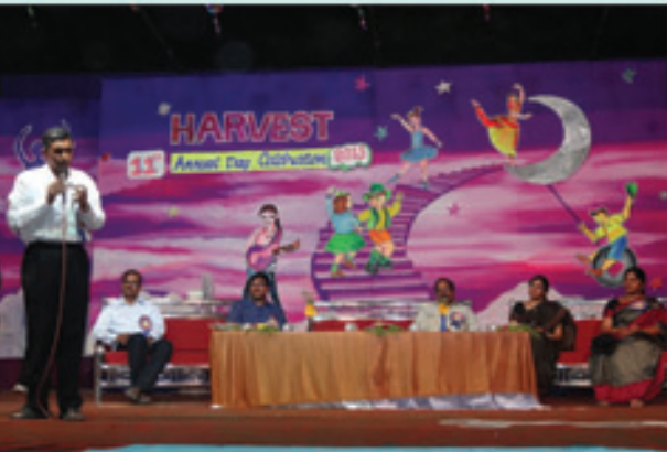
ఖమ్మం హార్వెస్ట్ స్కూల్ 11వ వార్షికోత్సవంలో జేపీ