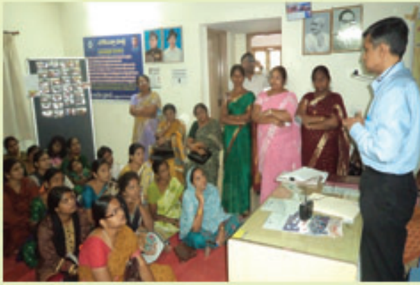
సర్దార్ పటేల్ నగర్ లోని మహిళల శిక్షణలో జేపీ