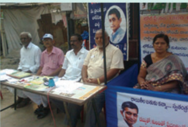
నరసరావుపేటలో సభ్యత్వ గమోదు కార్యక్రమం