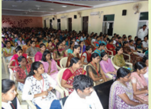
కమలా నెహ్రూ పాలిటెక్నిక్ మహిళా కళాశాలలో ప్రసంగిస్తున్న డా॥ జయప్రకాష్ నారాయణ్