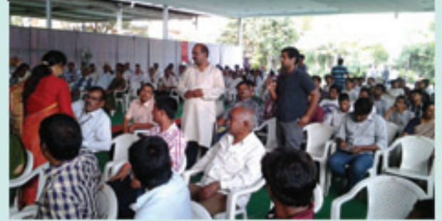
శేరిలింగంపల్లి నియోజకవర్గ లోక్సత్తా కార్యకర్తలతో జేపీ