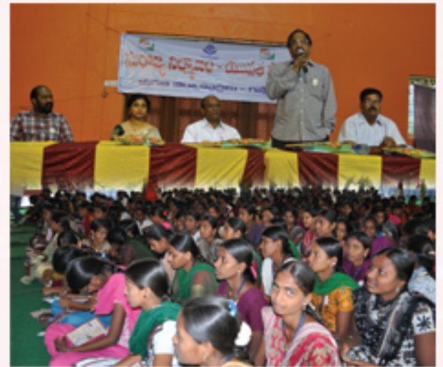
గజ్వేలులో విద్యార్థులతో ఎమ్మెల్యే సాగేశ్వర్