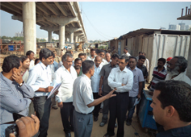
రైల్వే షైఫ్ వర్ పనులను పరిశీలిస్తున్న జేపీ