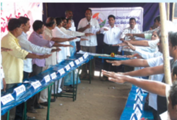
విజయనగరంలో మున్సిపల్ ప్రజా కౌన్సిల్