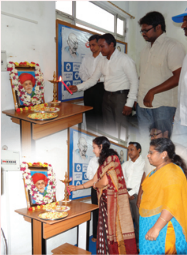
పార్టీ ఆఫీసులో జ్యోతిబాపూలేకు నివాళి