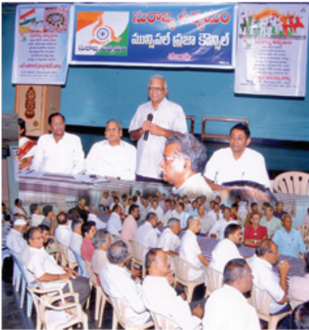
తణుకులో మున్సిపల్ ప్రజా కౌన్సిల్