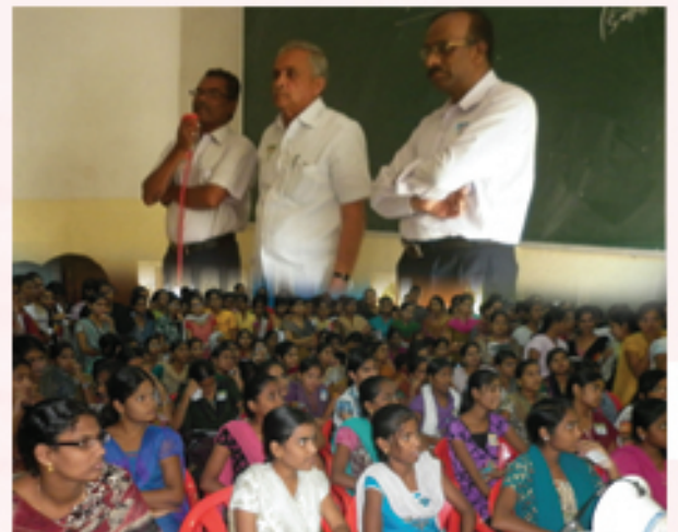
సురాజ్యంలో వివేకానంద నగర్ విద్యార్థులు