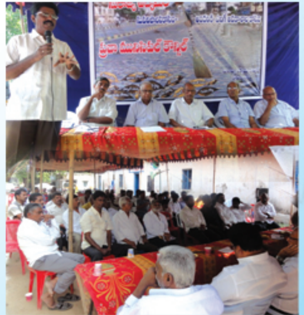
వినుకొండలో మున్సిపల్ ప్రజా కౌన్సిల్