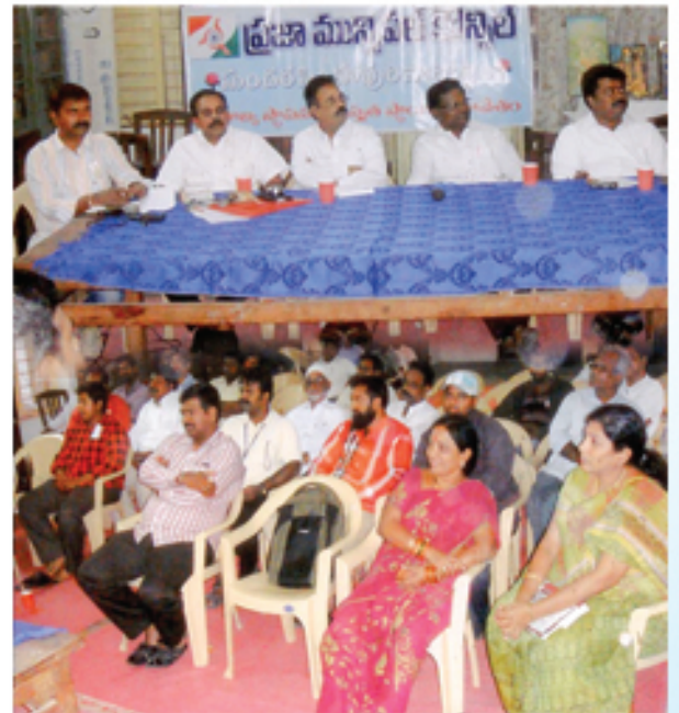
నెల్లూరులో మున్సిపల్ ప్రజా కౌన్సిల్