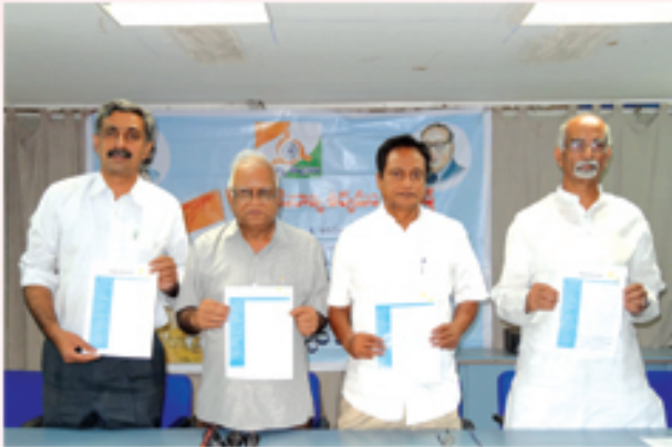
ఎమ్మెల్యేలకు జేపీ లేఖ పత్రికలకు విడుదల