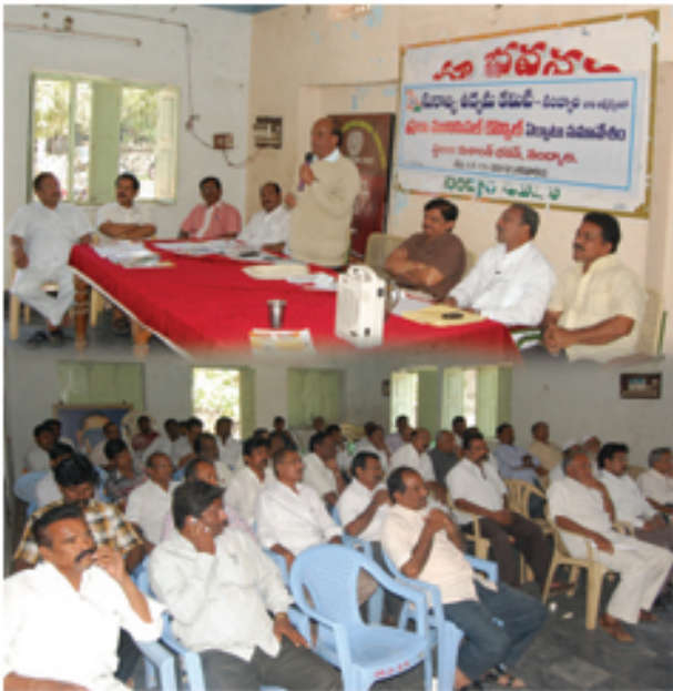
నంద్యాలలో మున్సిపల్ ప్రజా కౌన్సిల్