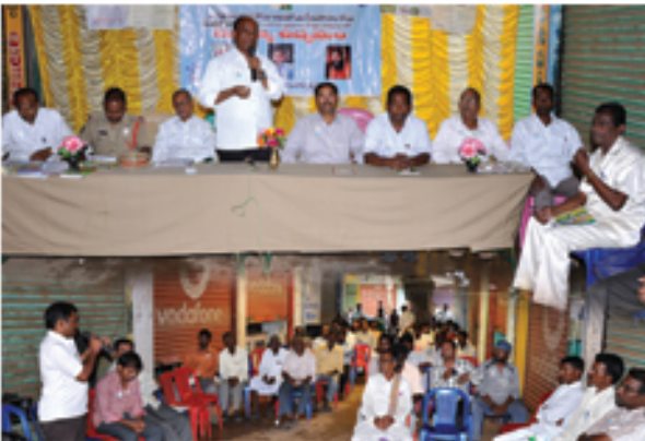
కర్నూలు జిల్లా నందికొట్కూర్లో జరిగిన సురాజ్యఉద్యమ రౌండ్ టేబుల్