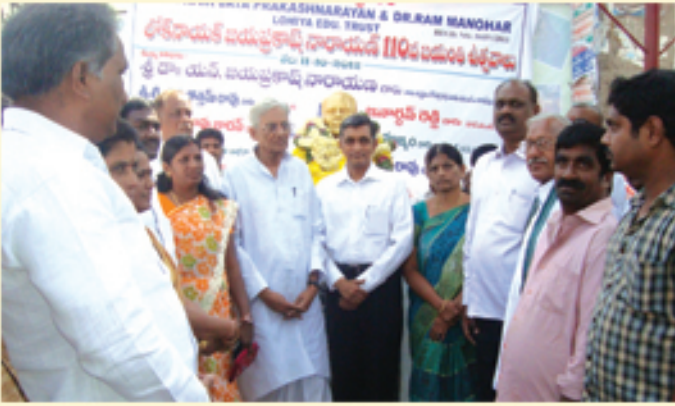
లోక్ నాయక్ జేపీ 110వ జయంతి ఉత్సవాలలో డా॥ జేపీ