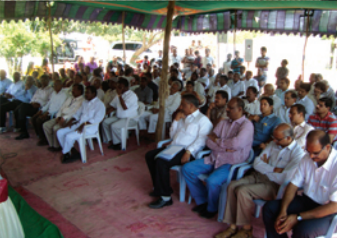
కూకట్‌పల్లిలో సమావేశంలో డా॥ జయప్రకాష్ నారాయణ్