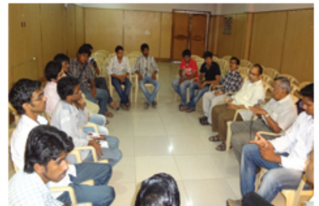
రాజమండ్రిలో యువసత్తా కమిటీ సమావేశం