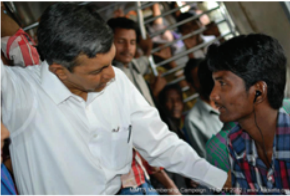
ఎం.ఎం.టి.ఎస్. ట్రైన్లో డా॥ జయప్రకాష్ నారాయణ్