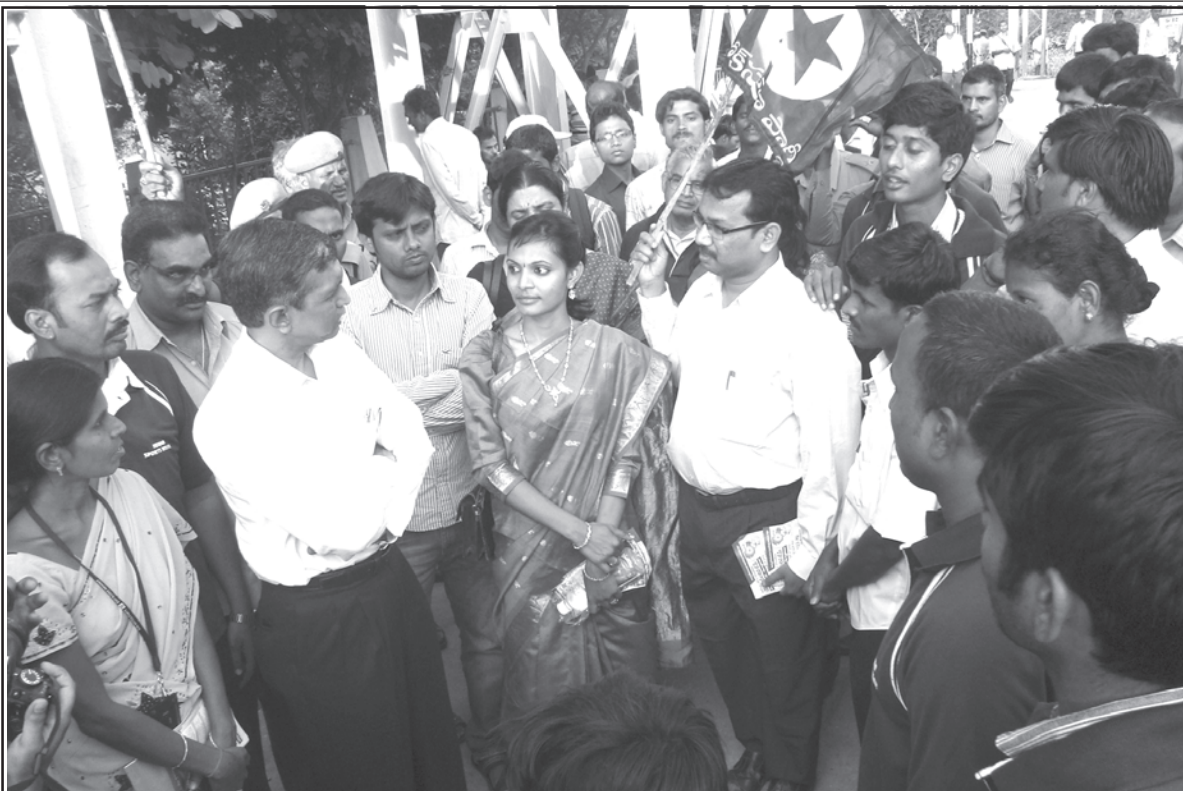
హైదరాబాద్‌లో ఎం.ఎం.టి.ఎస్. రైళ్ళలో సభ్యత్వ నమోదు కార్యక్రమంలో జేపీ