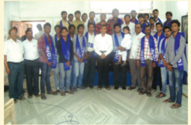
డా॥ జేపీ సమక్షంలో పార్టీలో చేరిన యువత