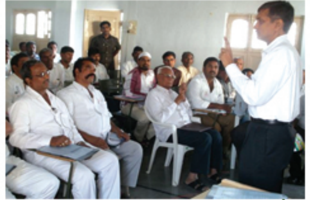
కర్నూలు, కడప, అనంతపురం జిల్లాల సురాజ్య ఉద్యమ కమిటీ శిక్షణా కార్యక్రమంలో మాట్లాడుతున్న జేపీ