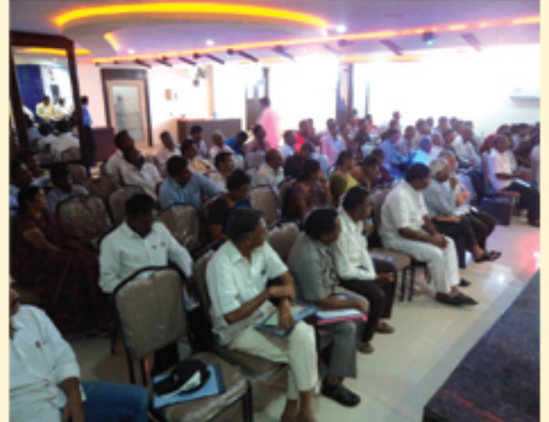
కూకట్‌పల్లిలో కార్యకర్తల సమావేశంలో డా॥ జయప్రకాష్ నారాయణ్