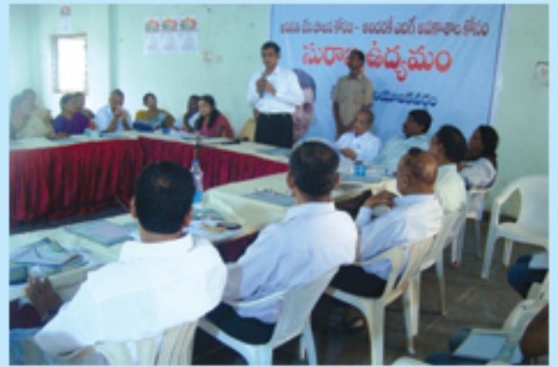
సనత్ నగర్ లో రాండ్ టేబుల్