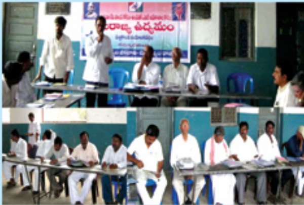
పత్తికొండలో రాండ్ టేబుల్