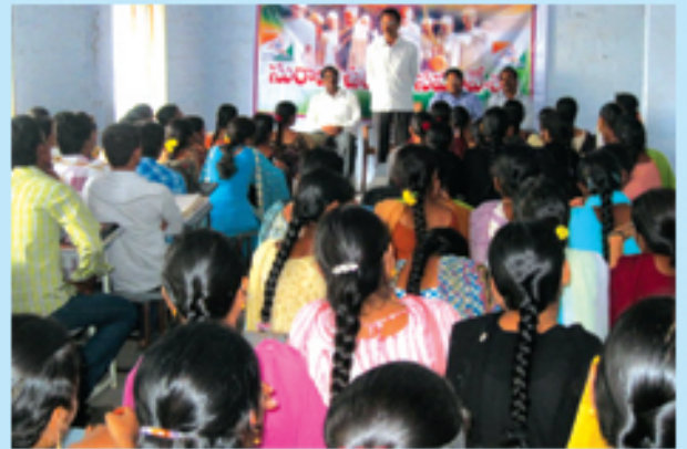
చిలకలూరిపేటలో సూర్య ఉద్యమం