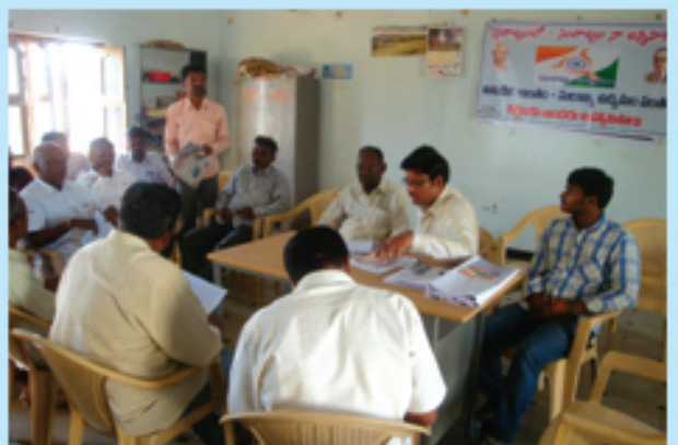
కల్వకుంట్లలో సూర్య ఉద్యమం