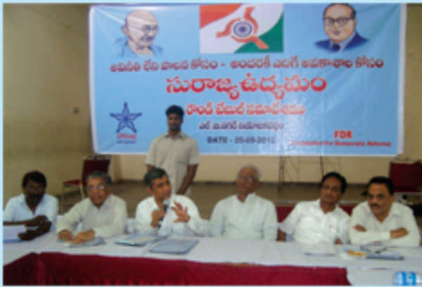
ఎల్బనగర్ లో రాండ్ టేబుల్