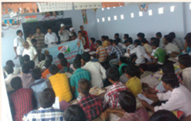
నరసరావుపేటలో సురాజ్య ఉద్యమం