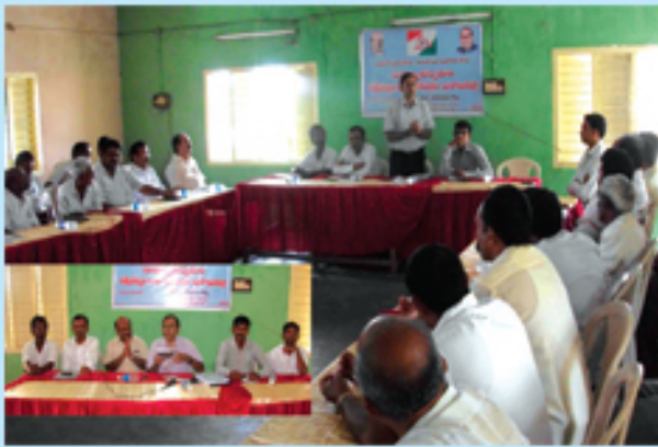
నర్సీపట్నంలో రాండ్ టేబుల్