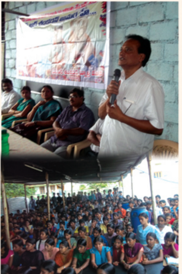
వనపర్తిలో సురాజ్య ఉద్యమం