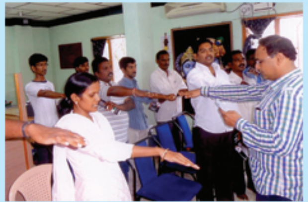
అమలాపురంలో సూర్య ఉద్యమ ప్రతిజ్ఞ