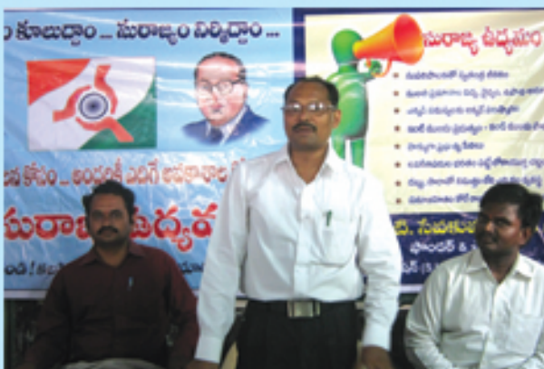
గుంటూరులో రాండ్ టేబుల్