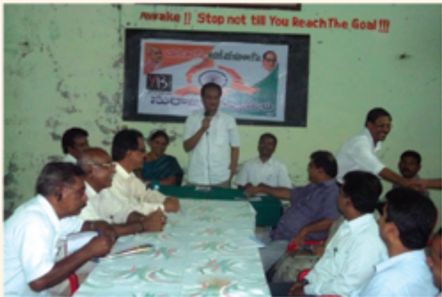
మహబూబ్ నగర్ లో రౌండ్ టేబుల్