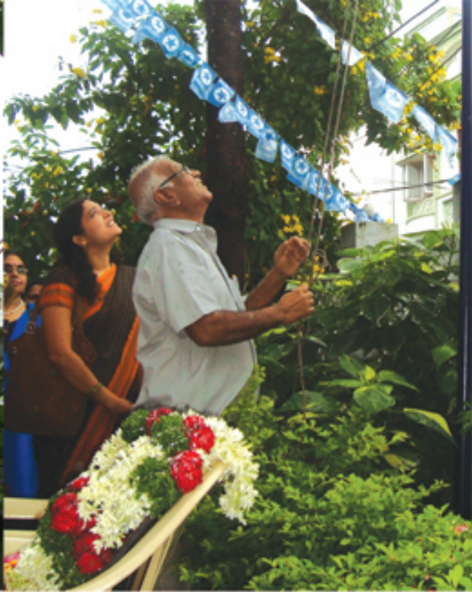
అక్టోబర్ 2 గాంధీ జయంతి సందర్భంగా రాష్ట్ర కార్యాలయంలో జెండా ఆవిష్కరణ