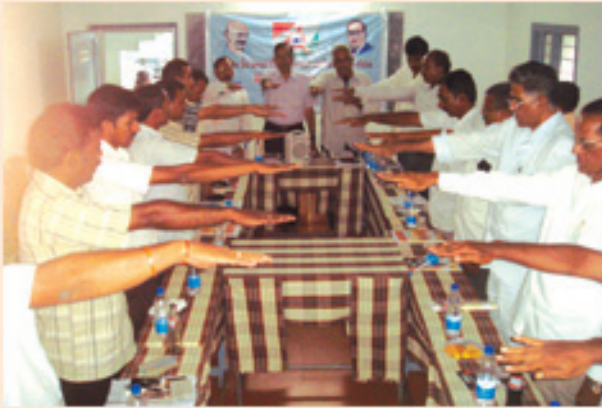
రామచంద్రపురంలో రాండ్ టేబుల్ సమావేశం