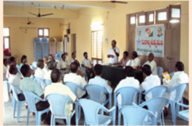
మెదక్లో సురాజ్య ఉద్యమం