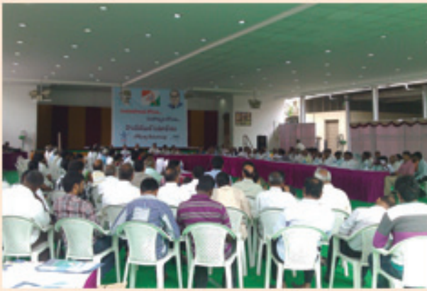
హైదరాబాద్లో శేరిలింగంపల్లి రాండ్ టేబుల్ సమావేశం