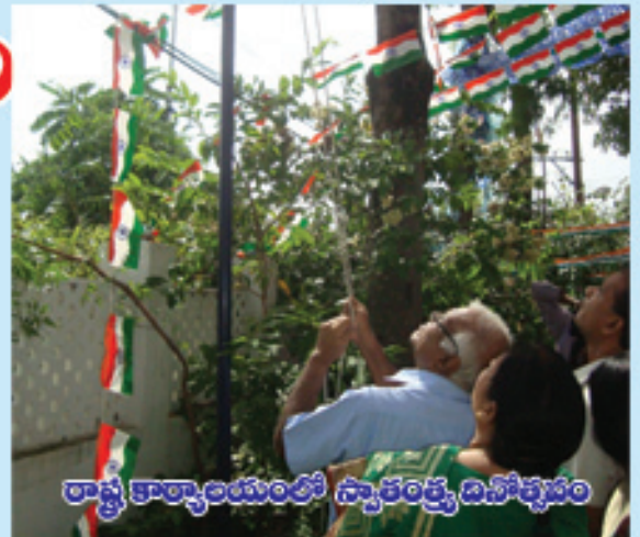
రాష్ట్ర కార్యాలయంలో స్వాతంత్ర్య దినోత్సవం