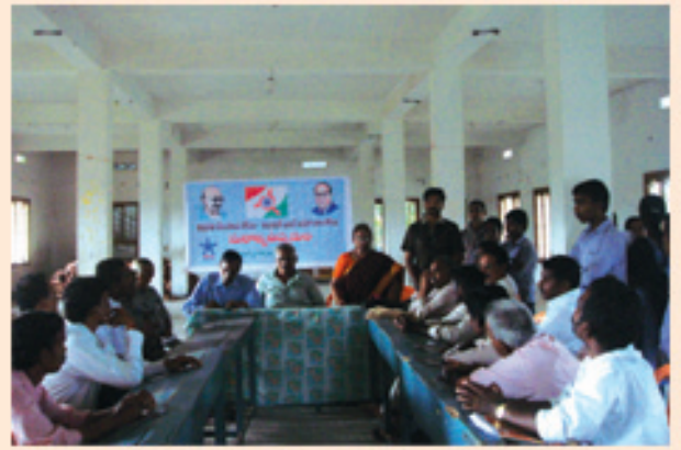
తూర్పుగోదావరిలో రాండ్ టేబుల్ సమావేశం