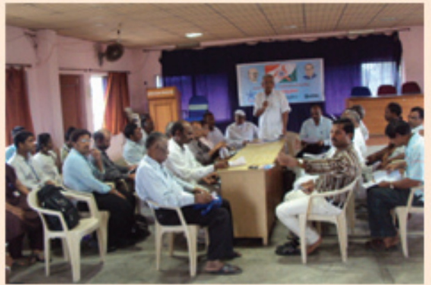
శ్రీకాకుళంలో రాండ్ టేబుల్ సమావేశం