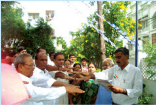
హైదరాబాద్ రాష్ట్ర కార్యాలయంలో