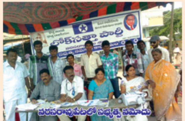
నరసరావుపేటలో సద్యత్వ సమీక్ష