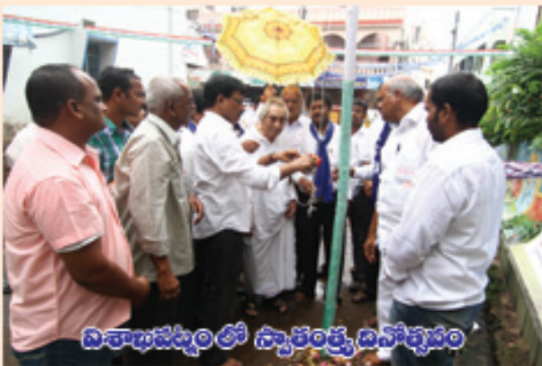
విశాఖపట్నం లో స్వాతంత్ర్య దినోత్సవం