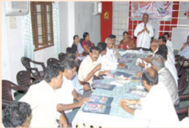
అదిలాబాద్ (తూర్పు) రాండ్ టేబుల్ సమావేశం