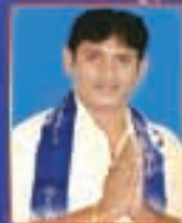
ఎ. చంద్రబాబు నాయుడు