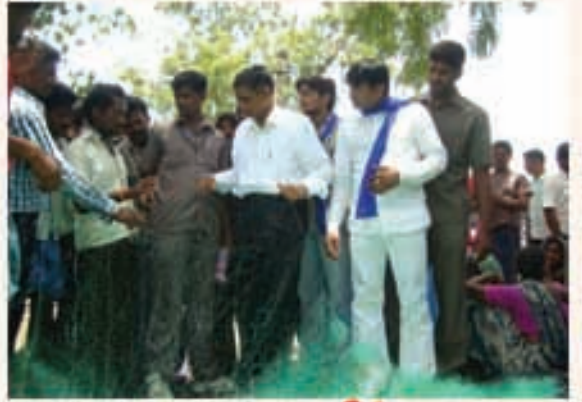
ఓంగాలు ఎన్నికల ప్రచారంలో డా॥ జేపీ