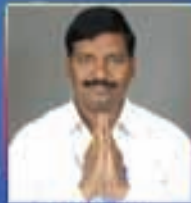
య. గోపీచంద్రబాబు నాయుడు