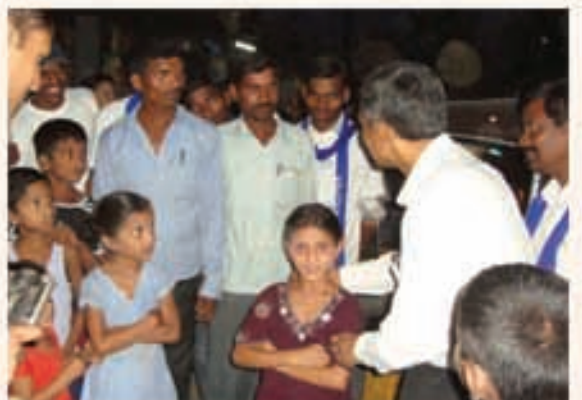
పరకాల ఎన్నికల ప్రచారంలో డా॥ జేపీ