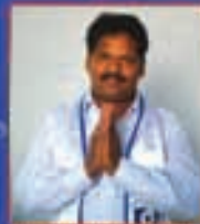
న. చంద్రబాబు నాయుడు