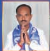
న. చంద్రబాబు నాయుడు