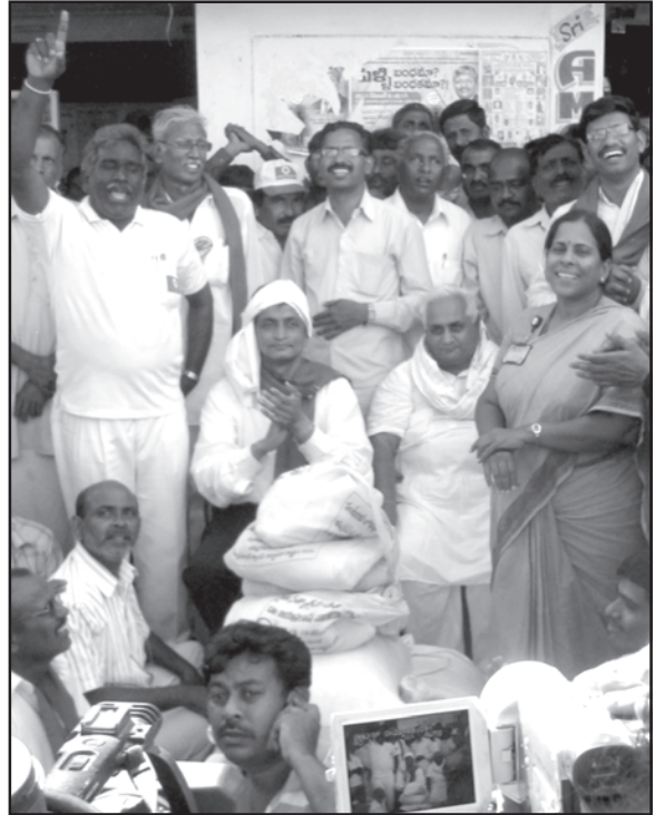
రైతు సత్కారహంలో భాగంగా ఆంధ్రప్రదేశ్ ప్రభుత్వ చట్టవిరుద్ధ ఆంక్షల్ని ఉల్లంఘించి, వేరే రాష్ట్రానికి బియ్యం తీసుకెళ్లే వేలం వేసి అమ్ముతున్న జేపీ (2012)