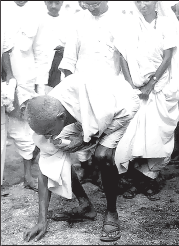
ఉప్పు సత్కారహంలో భాగంగా శాసనోల్లంఘన చేసి ఉప్పు తయారు చేస్తున్న బాపూ (1930)

వలస పాలకుల నుంచి భారతదేశానికి స్వాతంత్ర్యం తెచ్చే క్రమంలో నాడు మహాత్మాగాంధీ ఉప్పు సత్కారహా యాత్ర చేస్తే, వివక్ష లేకుండా అందరికీ ఎదిగే అవకాశాలున్న భారతదేశం కోసం చేస్తున్న రెండో స్వాతంత్ర్య పోరాటంలో భాగంగా లోక్ సత్తా పార్టీ అధ్యక్షుడు డా॥ జయప్రకాష్ నారాయణ్ నేడు స్వతంత్ర రైతుసంఘాల సమాఖ్య పతాకం మీద 'రైతు సత్కారహా యాత్ర' నిర్వహించారు. చట్టబద్ధంగా వ్యవహరించే కనీస నీతి ఉన్న తెల్లదొరల దురాగతాల మీద గాంధీ పోరాడితే, స్వదేశీ రాజ్యాంగానికి, చట్టాలకు విరుద్ధంగా తన ప్రజల మీదే కిరాతకంగా వ్యవహరిస్తున్న నల్లదొరల దాష్టీకానికి వ్యతిరేకంగా జేపీ సత్కారహా యాత్ర చేశారు.