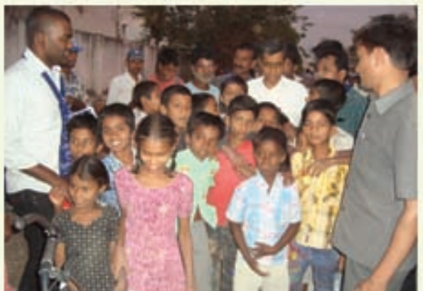
మహబూబ్ నగర్ ఉపఎన్నికల ప్రచారంలో డా॥ జయప్రకాష్ నారాయణ్