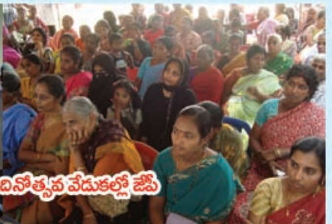
నెల్లూరులో మహిళా దినోత్సవ వేడుకల్లో జేపీ