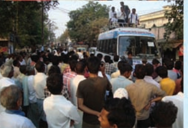
నెల్లూరు ఉపఎన్నికల ప్రచారంలో లోక్ సత్తా అభినేత జయప్రకాష్ నారాయణ్