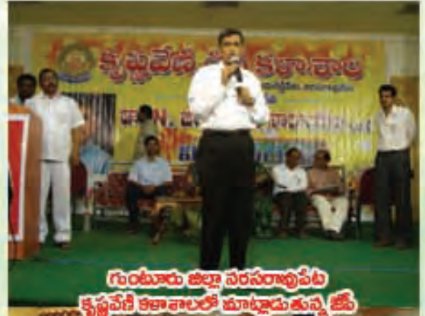
గుంటూరు జిల్లా వరసరావుపేట కృష్ణవేణి కళాశాలలో చూట్టూడుతున్న జేమ్