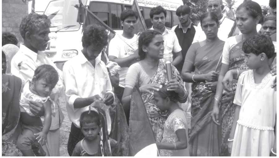
మధ్యం పై లోక్సత్తా గతంలో నిర్వహించిన ప్రచార ఉద్యమచిత్రం

అలాగే ప్రతిపక్ష నేతగా వున్న చంద్రబాబు ఈ మధ్యం సిండికేట్లలో నభ్యులుగా, బినామీలుగా వున్న నేతలను కట్టడి చేసే చర్యలు ప్రకటించాలి. సిండికేట్లనుండి బయటకు రాని వారిని, బెల్టుషాపులు నిర్వహించే వారిని అధికధరలకు అమ్మేవారిని, వాటి నుండి లబ్ధి పొందే వారిని పార్టీ నుండి దూరం