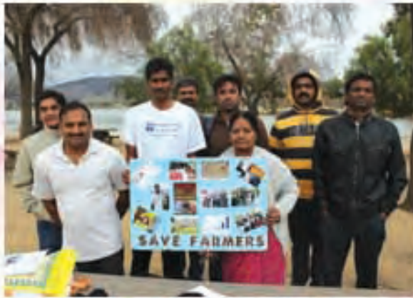
జేపీ రైతు సజ్జారహ పాదయాత్రకు మద్దతుగా 'బీ' పరియోలో (అమెరికా) సిఎఫ్ఎల్ సంఘభావం