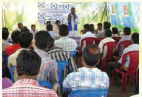
పార్వతీపురంలో మున్సిపల్ వార్డు శిక్షణ