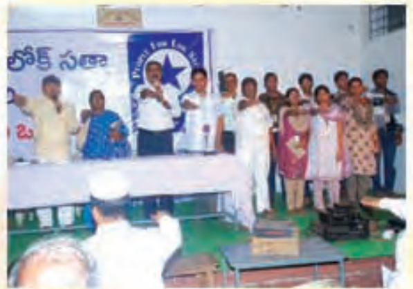
సిఎఫ్ఎల్ కార్యకర్తలచే 'అమెరికా రహిత ఒంగోలు' - విద్యార్థులతో ప్రతిష్ట