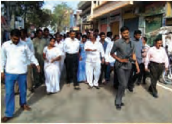
కె.పి. హెచ్.బి. కాలనీలో జేమ్ పాదయాత్ర