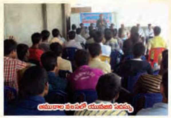
అమలాపల్లె వలసలో యువజన సదస్సు