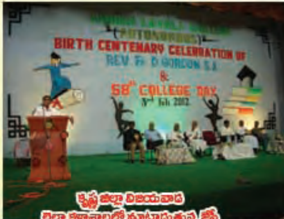
కృష్ణ జిల్లా విజయవాడ బ్రలా కళాశాలలో చూట్టూడుతున్న జేమ్