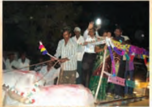
వరసరావుపేటలో ఎడ్లబండిమీద జేమ్