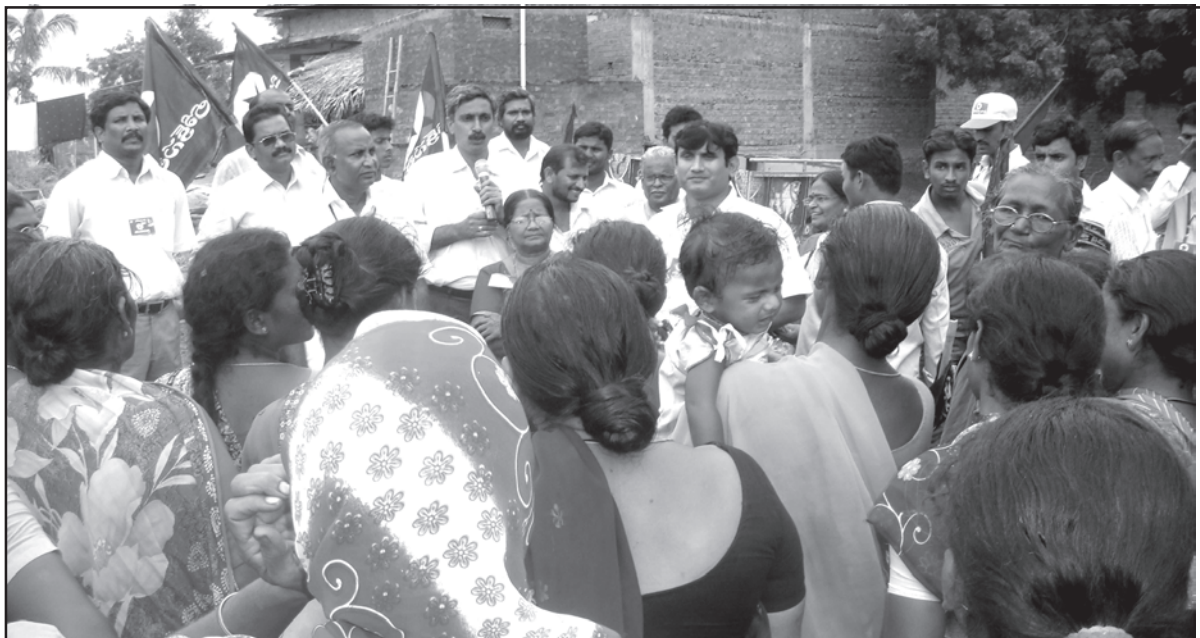
మద్య నియంత్రణ కోసం లోక్ సత్తా గతంలో నిర్వహించిన ప్రచార ఉద్యమచిత్రం

కృష్ణా జిల్లా మైలవరం మండలంలో జరిగిన కల్లీ సారా మరణాలపై జేపీ పార్టీ ప్రధాన కార్యాలయంలో మీడియాతో మాట్లాడుతూ... మైలవరంలో కల్లీసారా వ్యాపారం వెనక రాజకీయ పార్టీల ప్రమేయం ఉందని కృష్ణాజిల్లా లోక్ సత్తా నేతల నిజనిర్ధారణలో స్పష్టంగా తేలిందని అన్నారు. రాజకీయ నేతలు, స్థానిక ప్రభుత్వ యంత్రాంగం ప్రమేయంతోనే ఈ దారుణం జరిగిందన్నారు. కందిమర్ల వంటి గ్రామాలలో వీరంతా లాలూచీ పడి నాటుసారా వ్యాపారం