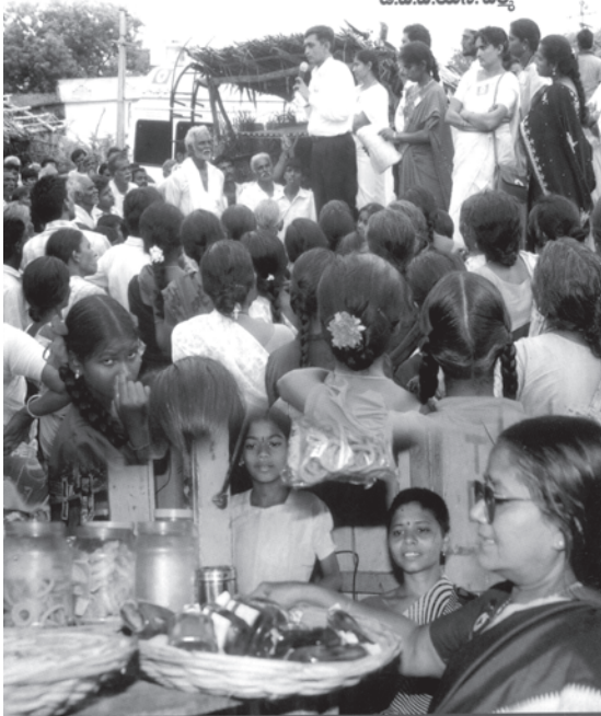
బెల్టుషాపులపై లోక్సత్తా పార్టీ సమరభేరి

దూబగుంట నుంచి లోక్సత్తా మధ్యనియంత్రణ చైతన్యయాత్ర 22 వరకూ... 16 జిల్లాలు... శ్రీకాకుళం వరకూ చైతన్యరథానికి జెండా ఊపి ప్రారంభించిన జేపీ -“సాంప్రదాయపార్టీలంటే సా.రా పార్టీలని” ధ్వజం-