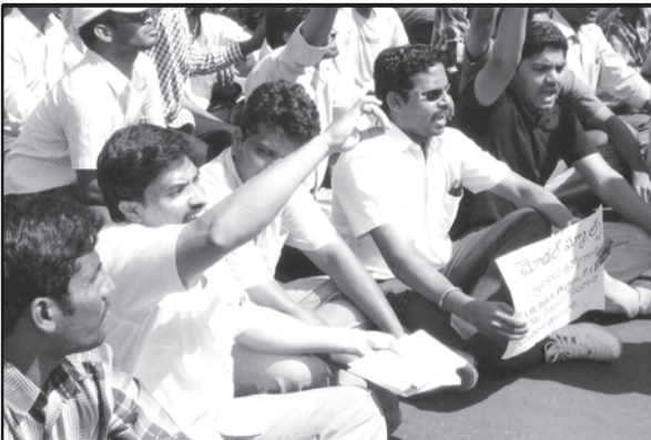
మోడల్ స్కూల్స్ ఉపాధ్యాయుల రిక్రూట్ మెంట్ లో నిబంధనలు మార్చాలని ధర్మా చేస్తున్న ఆంధ్రా యూనివర్సిటీ విద్యార్థులు