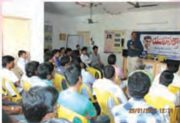
విశాఖపట్టణంలో యువసత్తా శిక్షణ కార్యక్రమం