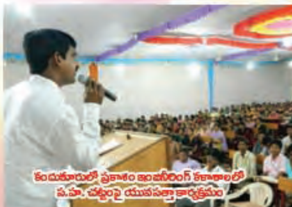
కందుకూరులో ప్రకాశం ఇంజనీరింగ్ కళాశాలలో ప.పా. చట్టంపై యువసత్తా కార్యక్రమం