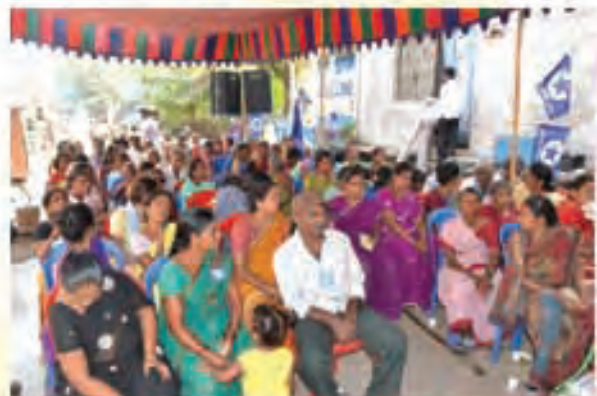
విజయనగరం జిల్లాలో మున్సిపల్ వార్డు శిక్షణ