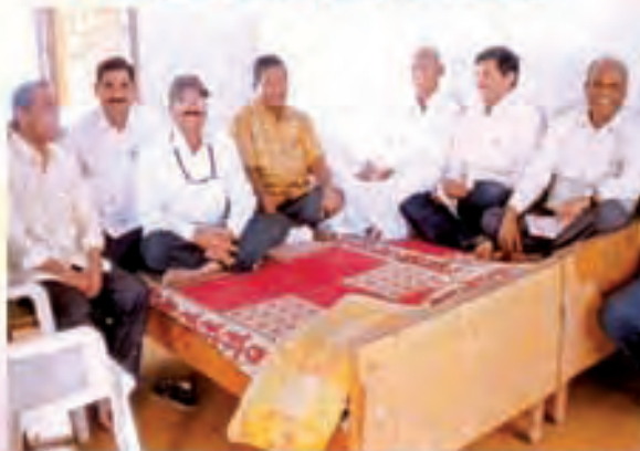
జేపీ పాదయాత్ర ప్రార్థనలు చేస్తున్న సమయంలో సైకుల సందశాల నేతలు