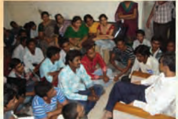
పొట్టి శ్రీరాములు ఇంజనీరింగ్ కాలేజీ విద్యార్థులతో జేమ్ ...