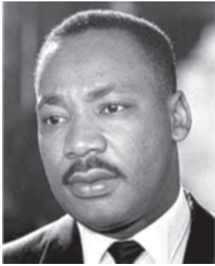
మనం సోదరుల్లా కలిసి జీవించటం నేర్చుకోవాలి లేదంటే ముర్ఖుల్లా నశించక తప్పదు - మార్టిన్ లూథర్ కింగ్ జూనియర్