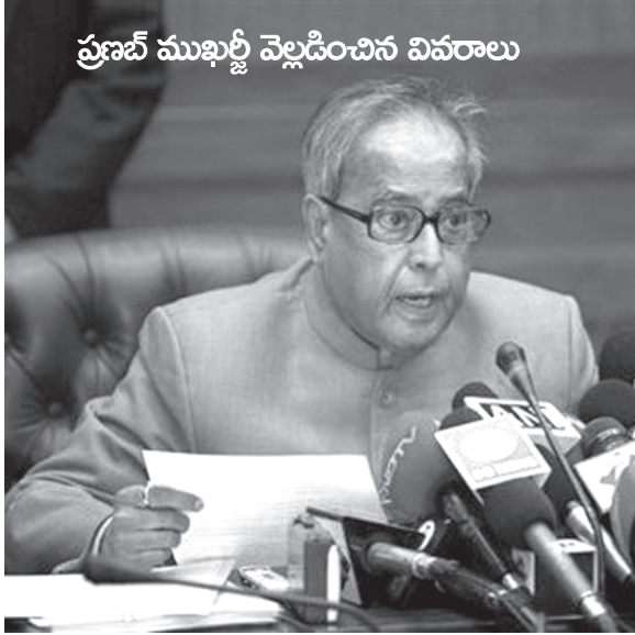
ప్రణబ్ ముఖర్జీ వెల్లడించిన వివరాలు