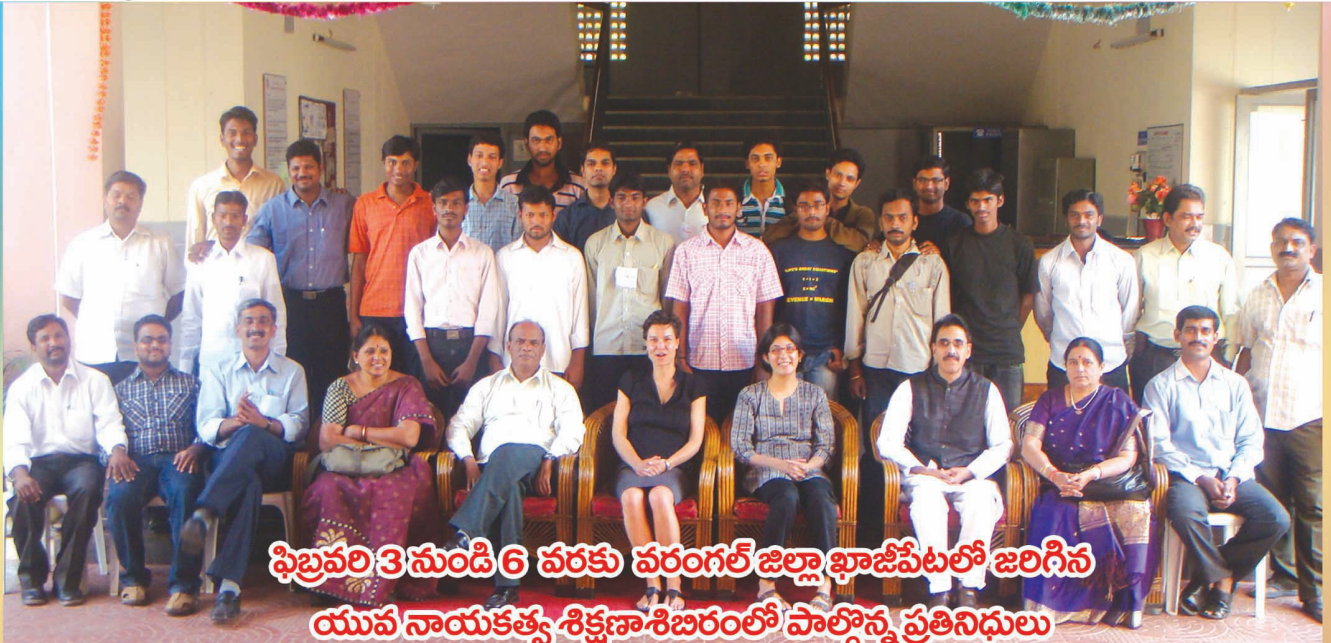
ఫిబ్రవరి 3 నుండి 6 వరకు వరంగల్ జిల్లా ఖాజీపేటలో జరిగిన యువ నాయకత్వ శిక్షణా శిబిరంలో పాల్గొన్న ప్రతినిధులు