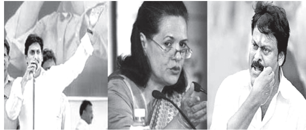
పాత్యా... విలీనమా... పి.ఆర్.పీ డైలమా

రాష్ట్రంలో కాంగ్రెస్ పార్టీ అంతర్గతస్థితి దయనీయంగా వుంది. ఒక పక్క జగన్ ప్రభుత్వాన్ని పడగొట్టనంటూనే దానిని చీల్చుకుంటూ పోతున్నాడు. రోజుకో యాత్ర సాగిస్తూ కాంగ్రెస్ పార్టీని ఉక్కిరి బిక్కిరి చేస్తున్నాడు. 25-30 మంది శాసన సభ్యులు అటు జగన్ తో ఇటు కాంగ్రెస్ తో దోబూచులాడు తున్నారు. వాళ్లపై చర్యతీసుకునే స్థితిలో అటు అధిష్టానం లేదు. అదుపుచేసే శక్తి రాష్ట్ర కాంగ్రెస్ కు లేదు. వేచిచూడడమే ఇద్దరి మార్గంగా కనిపిస్తున్నది.