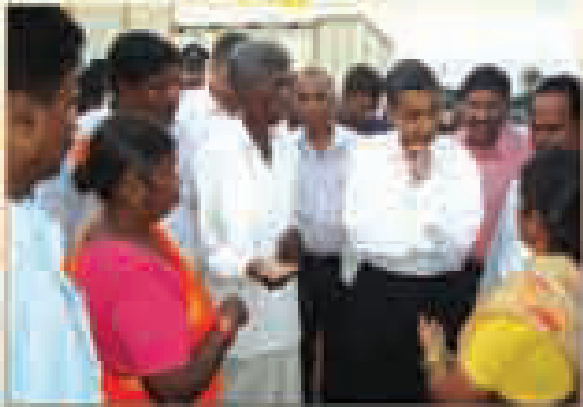
పాఠశాల ప్రారంభం వేడుకల సందర్భంగా