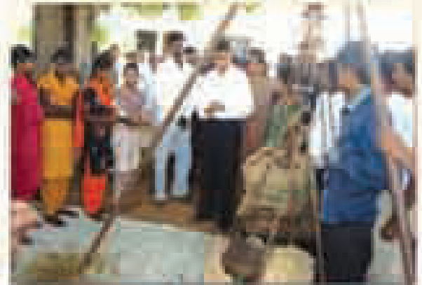
పాఠశాల ప్రారంభం వేడుకల సందర్భంగా