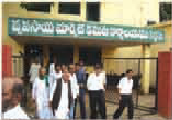
పాఠశాల ప్రారంభం వేడుకల సందర్భంగా