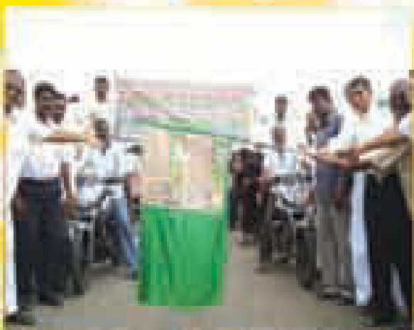
పాఠశాల ప్రారంభం వేడుకల సందర్భంగా