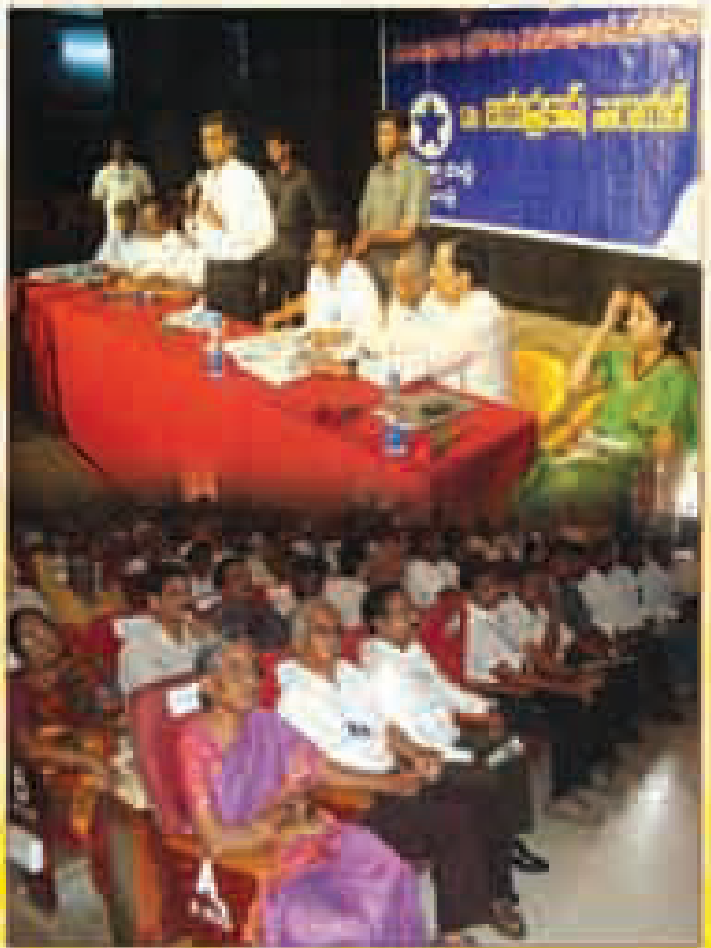
పాఠశాల ప్రారంభం వేడుకల సందర్భంగా