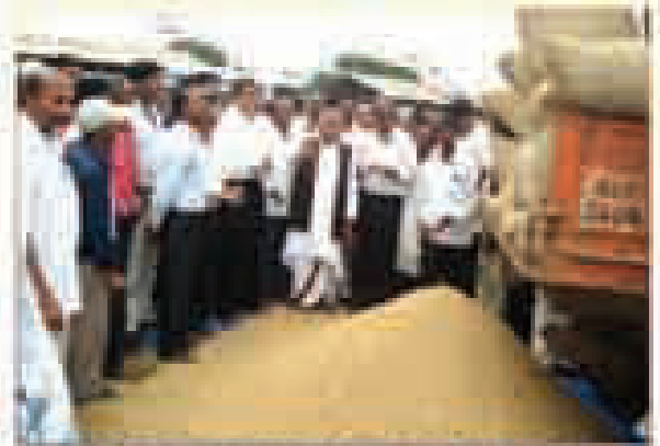
పాఠశాల ప్రారంభం వేడుకల సందర్భంగా