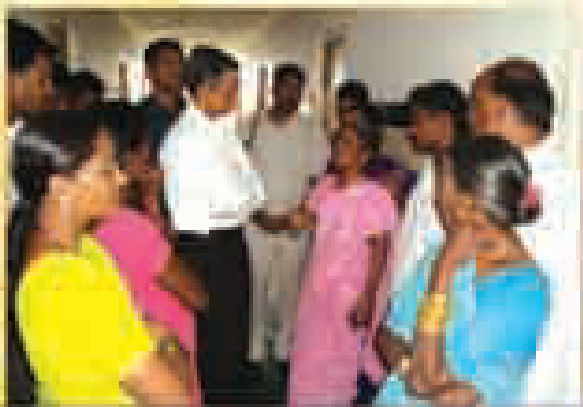
పాఠశాల ప్రారంభం వేడుకల సందర్భంగా