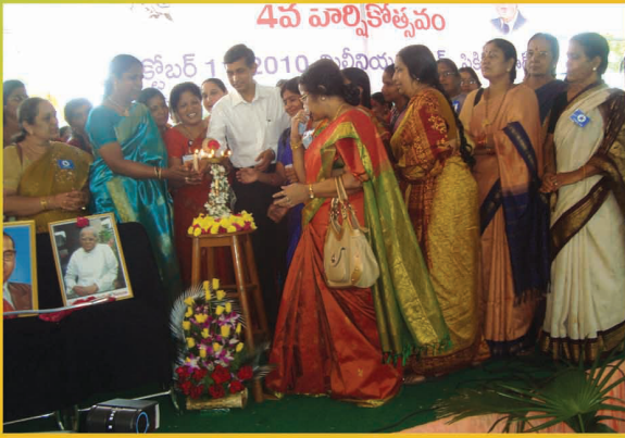
జ్యోతి ప్రజ్వలన చేస్తున్న మహిళలతో డా॥ జేపీ