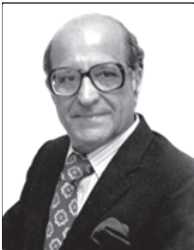
పేదరికం కారణంగా ఇంతవరకూ ఏ దేశం నమసిపోలేదు. అవినీతి కారణంగానే దేశాలు నేలమట్టమయ్యాయి