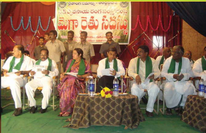
గుడివాడలో రైతాంగ సదస్సునుద్దేశించి ప్రసంగిస్తున్న డా॥ జేపీ