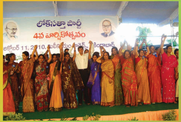
మహిళాసత్తా నాయకురాల్యతో డా॥ జేపీ