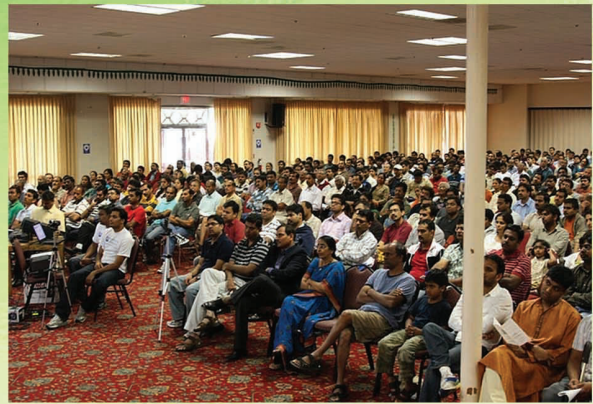
బే ఏరియా లో