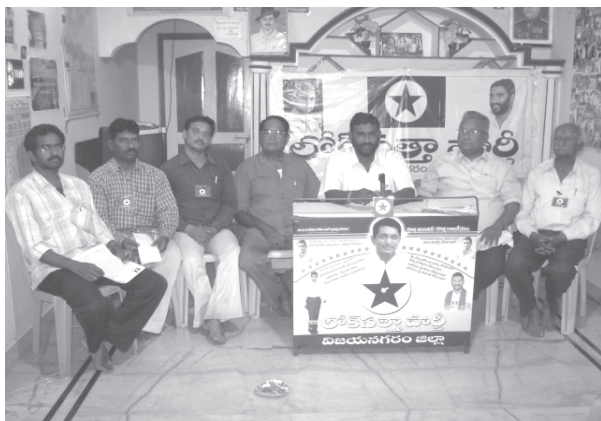
జిందాల్ భూసేకరణలో అవినీతి నిజమే