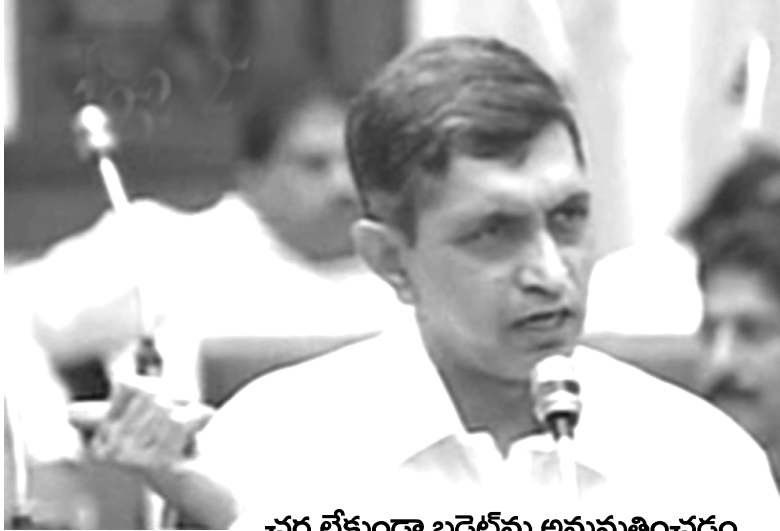
చర్చ లేకుండా బడ్జెట్ను అనుమతించడం