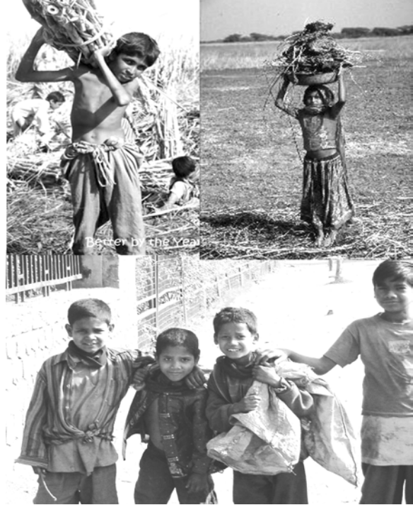
బాల కార్మిక వ్యవస్థ ప్రధానంగా రెండు రకాలుగా కొనసాగుతుంది.

బాలకార్మిక వ్యవస్థ కొనసాగడానికి అనేక కారణాలున్నాయి. చిన్న, పెద్ద కంపెనీలు, వ్యవసాయ క్షేత్రాలు, గృహోపసరాల్లో చిన్న పిల్లలను కార్మికులుగా చేర్చుకుంటున్నారు. బాల కార్మికులకు ఇచ్చే స్వల్పమైన వేతనాల మూలంగా వారికి ఆదాయాలు, ప్రధాన కారణంకాగ, పిల్లలు కార్మికులుగా పనిచేయడం వల్ల తమకు చేదోడు వాదోడుగా ఉండటంతో కొద్దిగా అయినా డబ్బు వస్తుందని తల్లిదండ్రులు భావించడం మరో కారణం దాంతో వ్యక్తిగతంగా, సామాజికంగా పిల్లలు తీవ్రంగా నష్టపోతున్నారు.