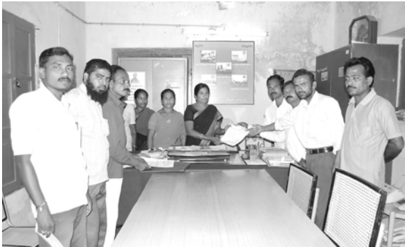
చర్యలు తీసుకోవాలని వినతి