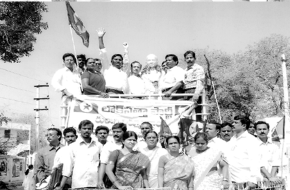
అన్ని వర్గాల సంక్షేమానికి ఉద్యమం అనంతపురం