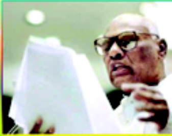
సంక్షేమాల పేరిట కళ్ళుగప్పేదింటెన్నాళ్ళు?