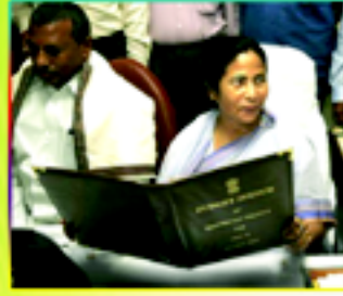
రైల్వేల వికేంద్రీకరణ ఎప్పుడు?