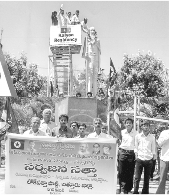
రాజ్యాంగ అవగాహన కోసం సర్వజనసత్తా కార్యక్రమం చిత్తూరు