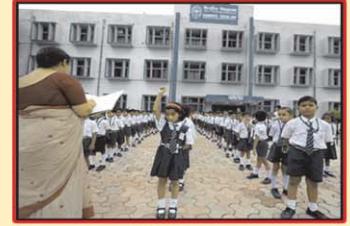
మంచి పాఠశాల విద్య ఆటపాటల బాల్యం ఉన్నత చదువులు