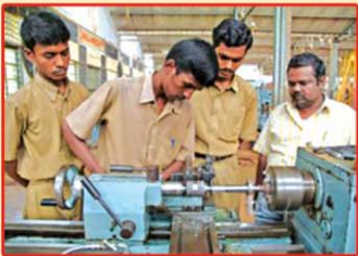
చాలీచాలని సంపాదన నిరుద్యోగం

మీ బిడ్డకి మీరేమిస్తారు మీరే తేల్చుకోండి