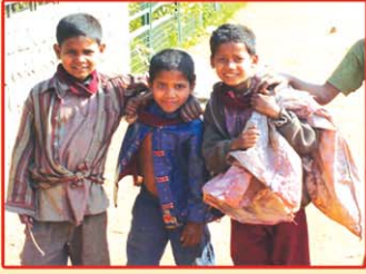
నాసిరకం చదువు పై చదువులకి దూరం