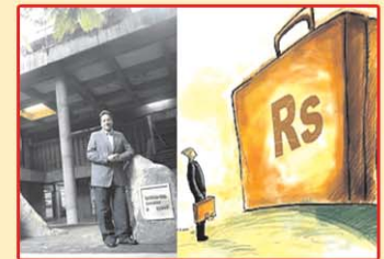
మంచి ఉద్యోగాలు మంచి సంపాదన

ప్రభుత్వ - ప్రయివేటు స్కూళ్ళలో ఒకే ప్రమాణాలు